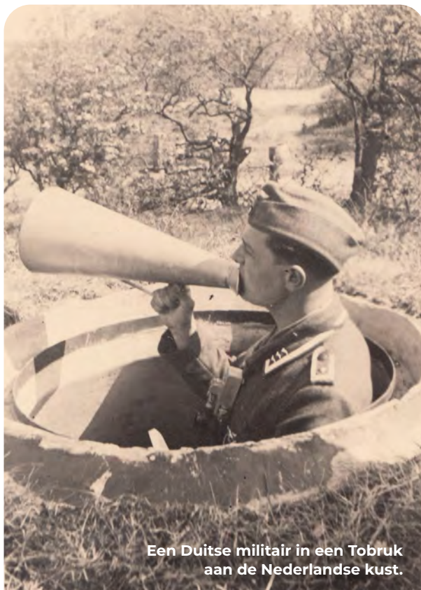
Een Duitse militair in een Tobruk aan de Nederlandse kust.

Onder het zand en tussen de duindoorns liggen resten van een stelling die het noordelijkste deel van het verdedigingsgebied moest beveiligen. Open loopgraven, met de hand gegraven en versterkt met hout, takkenvlechtwerk en grasplaggen, verbonden de verschillende opstellingen met elkaar. Ter hoogte van de strandopgang lag bovendien een tankmuur; deze is na de oorlog gesloopt en onder het zand verdwenen. Aan de buitenranden van het complex lagen verschillende kleine betonnen bunkertjes, zogenoemde Ringstände of Tobrukstände. Die naam komt van de Libische plaats waar ze in 1941 door het Italiaanse leger werden gebouwd en de Duitsers als model dienden. Aan je linkerhand zie je er een liggen. Een (mitrailleur)schutter kon vanuit deze veilige posities met een 360 graden blik verdekt vuur uitbrengen. In de Atlantikwall zijn er duizenden van gebouwd.