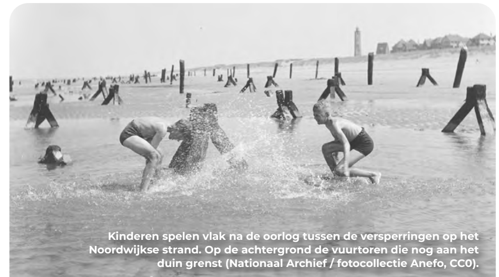
Kinderen spelen vlak na de oorlog tussen de versperringen op het Noordwijkse strand. Op de achtergrond de vuurtoren die nog aan het duin grenst (Nationaal Archief / fotocollectie Anefo, CCO).

Op Vuurtorenplein (KP 32), met je rug naar de zee RD en daarna LA richting KP 33. Je fietst nu op het Wantveld. Al snel maakt de weg een bocht naar rechts en gaat over in de Northgodreef. Net voor de bocht ligt aan je linkerhand een stuk duin waarin een verzande loopgraaf is verborgen. Vanaf de parkeerplaats van de voormalige manege is deze nog terug te vinden.