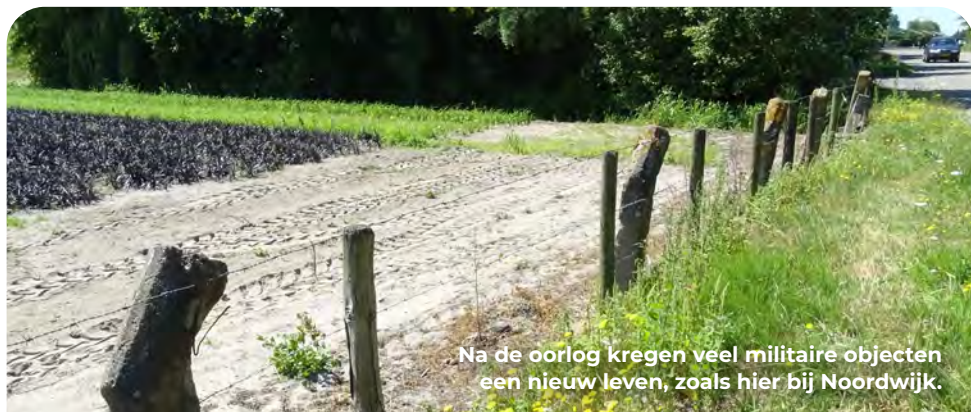
Na de oorlog kregen veel militaire objecten een nieuw leven, zoals hier bij Noordwijk.

Na 1945 bleken de vrijgekomen betonnen profielen uitstekend bruikbaar als afrastering. In de hele regio zijn nog sporen van dit hergebruik te vinden; oorlogsmateriaal dat opgaat in het alledaagse landschap.