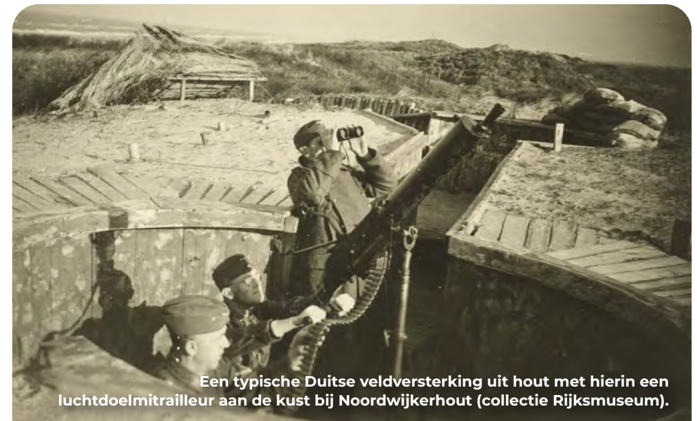
Een typische Duitse veldversterking uit hout met hierin een luchtdoelmitrailleur aan de kust bij Noordwijkerhout.

Tot in de jaren 50 lag er op de plek van het huidige Oosterduinse meer een prachtig duingebied, de Oosterduinen. Na de oorlog werd hier zand gewonnen voor het maken van kalkzandsteen. De achtergebleven zandput vulde zich op met water en vormde het meer. Tijdens de oorlog lag op deze plek een Duitse infanteriestelling en een luchtafweerbatterij. De stellingen waren simpel van opzet. De infanteriestelling bestond uit tientallen meters open loopgraaf die mitrailleursteden en mangaten met elkaar verbonden. Deze zogenaamde veldversterkingen waren met hout verstevigd. Hetzelfde geldt voor de aanwezige luchtafweerbatterij. Deze bestond uit