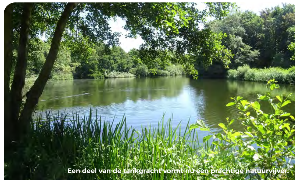
Een deel van de tankgracht vormt nu een prachtige natuurvijver.

De vijver is niet het enige spoor van de oorlog. Ten westen van de tankgracht werd een steunpunt aangelegd die deze gracht en de vlakbij gelegen ingang tot het verdedigingsgebied moest beschermen. Het was een omvangrijke stelling waar in