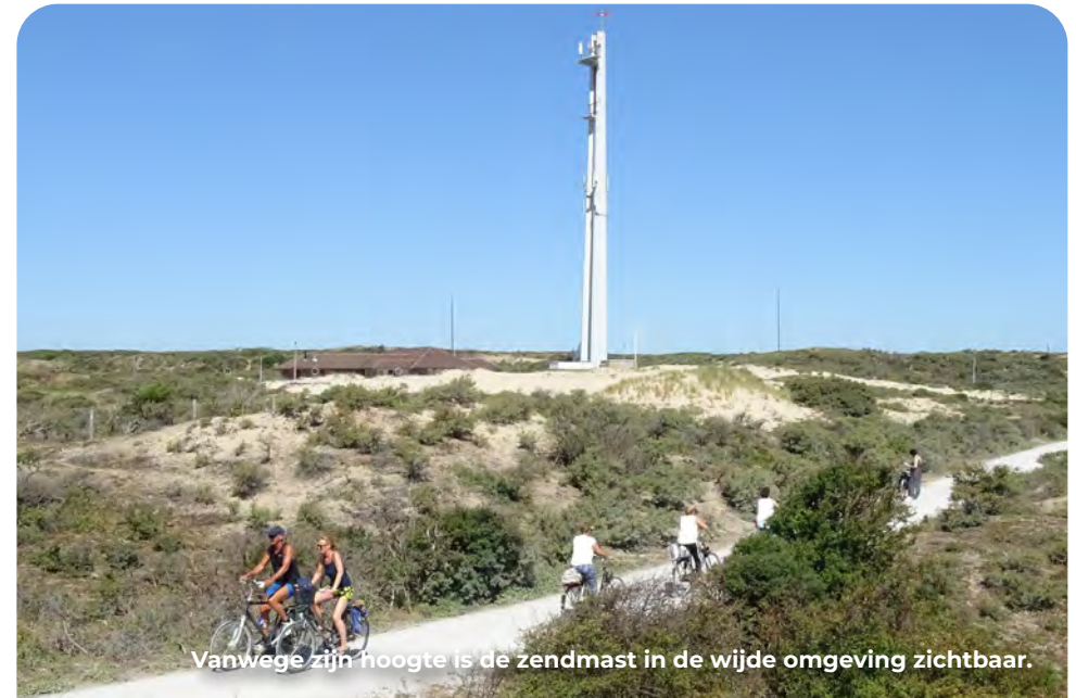
Vanwege zijn hoogte is de zendmast in de wijde omgeving zichtbaar.