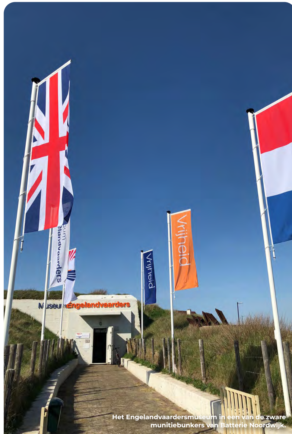
Het Engelandvaardersmuseum in een van de zware munitiebunkers van Batterie Noordwijk.