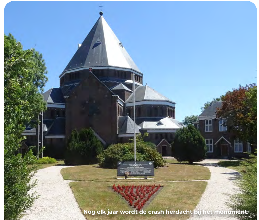
Nog elk jaar wordt de crash herdacht bij het monument.