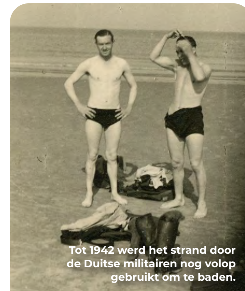
Tot 1942 werd het strand door de Duitse militairen nog volop gebruikt om te baden.

Op circa 30 meter achter het hek lag een rechthoekig zwembad. Het bad werd speciaal voor het personeel van de kustbatterij aangelegd omdat er in de buurt geen openbaar zwembad was en het strand vanaf 1942 grotendeels tot Sperrgebiet was verklaard. De vele versperringen en mijnenelden maakten het zwemmen hier onmogelijk. Ook na de oorlog bleef het bad nog jaren in gebruik. Vele Noordwijkers hebben hier hun eerste zwemlessen gehad. Nu verraadt alleen een rechthoekige verlaging met hogere bosschages en bomen de locatie van de achtergebleven betonnen bak.