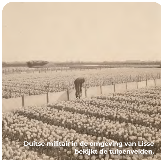
Duitse militair in de omgeving van Lisse bekijkt de tulpenvelden.