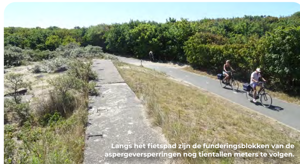
Langs het fietspad zijn de funderingsblokken van de aspergeversperringen nog tientallen meters te volgen.