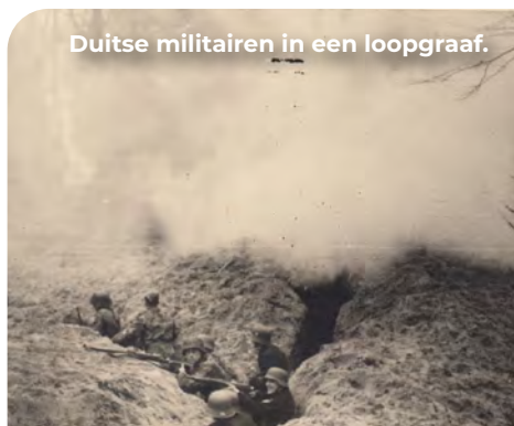
Duitse militairen in een loopgraaf.

Aan de Northgodreef ligt links voor de ingang van het duingebied, ter hoogte van het einde van de parkeerplaats, een restant van een open loopgraaf. Dit simpele, maar doeltreffende verdedigingswerk werd met de hand uitgegraven en met hout, plaggen of andere materialen versterkt. Tijdens een (lucht)aanval hadden de soldaten zo een gedekte looproute.