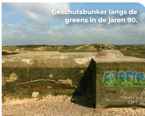
Geschutsbunker langs de greens in de jaren 90.

Deze loopgraaf had een typerende zigzagvorm en stond in verbinding met een opstelling voor een mitrailleursschutter. De loopgraaf is als greppel herkenbaar. De opstelling voor de mitrailleur is door het zandpaadje helaas verloren gegaan. Deze loopgraaf maakte deel uit van een keten van versperringen en verdedigingswerken die de batterij tegen aanvallen vanuit het binnenland moest beschermen. Ook hier verrezen zware betonnen bunkers en open opstellingen. Als je via het schelpenpad het duin in gaat, zie je aan je linkerhand op een hoog duin een van deze open opstellingen liggen. Als je het schelpenpad verder vervolgt, zie je aan je linkerhand een hoog duin met uitstekende stukken beton. Hieronder ligt nog nu nog een van de geschutsbunkers. Tot begin jaren zeventig lag in dit duingebied de Noordwijkse golfclub. Bij regen en harde wind bood de bunker een welkome bescherming aan de golfers.