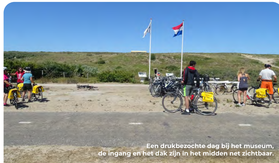
Een drukbezochte dag bij het museum, de ingang en het dak zijn in het midden net zichtbaar.

Wat direct opvalt aan het Atlantikwall Museum Noordwijk is de ingang onder aan het duin en het verderop hoger liggende uitstekende dak van de vuurleidingspost. Deze bunker (Leitstand type S414) vormde ooit het zenuwcentrum van de kustbatterij, waarvan de bouw 1.800 kubieke meter beton vergde. Een hedendaagse cementwagen zou hiervoor 180 ritten moeten maken. Vanuit de enorme bunker werd het commando gevoerd over de Marine Seeziel Batterie Noordwijk en bevelen en schootsrichtingen doorgegeven aan de kanonnières die het geschut bedienden.