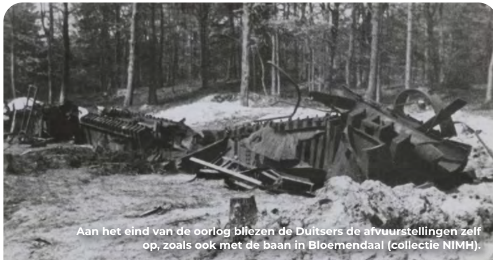
Aan het eind van de oorlog bleven de Duitsers de afvuurstellingen zelf op, zoals ook met de baan in Bloemendaal (collectie NIMH).

De V1 was een onbemand straalvliegtuig met een bomkop, gelanceerd vanaf een stalen rail (Abschussrampe). Met behulp van een automatische piloot en gyrokompas vloog de bom naar een vooraf ingesteld doel, waar hij met honderden kilo's springstof enorme schade kon aanrichten. In het kader van Unternehmen Pappdeckel werden begin 1945 plannen gemaakt voor 21 lanceerstellingen langs de Nederlandse kust met als doel Engeland en vooral Londen. Ook in het beschutte