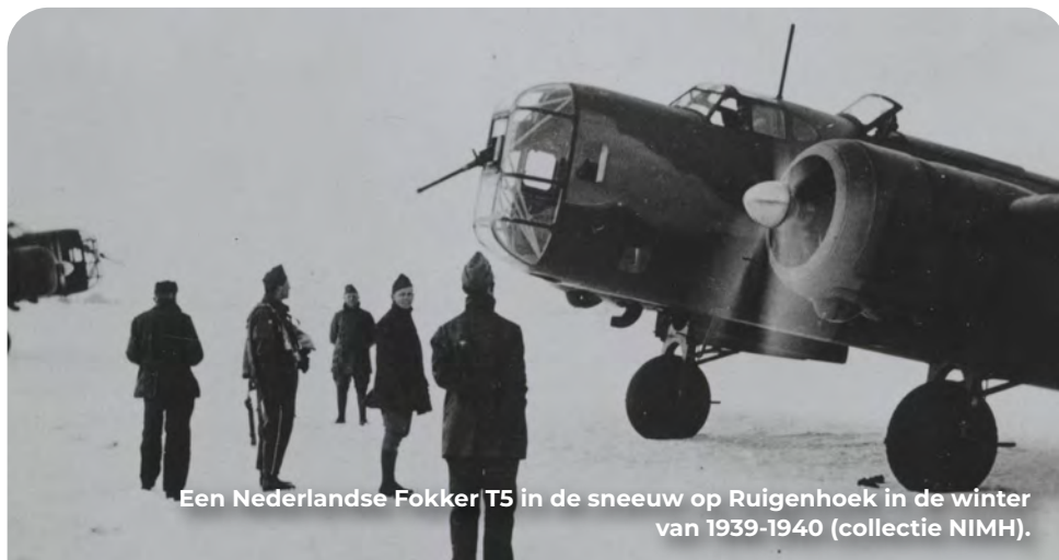
Een Nederlandse Fokker T5 in de sneeuw op Ruigenhoek in de winter van 1939-1940.

Op 10 mei 1940 vielen Duitse bommenwerpers tal van militaire doelen in Nederland aan, maar Ruigenhoek bleef gespaard. Tot aan de capitulatie vijf dagen later voerden Nederlandse toestellen vanaf hier tientallen missies uit, waaronder verkenningsvluchten en luchtaanvallen. Na het bevel de strijd te staken werden de nog aanwezige vliegtuigen in brand gestoken om te voorkomen dat zij in Duitse handen vielen.