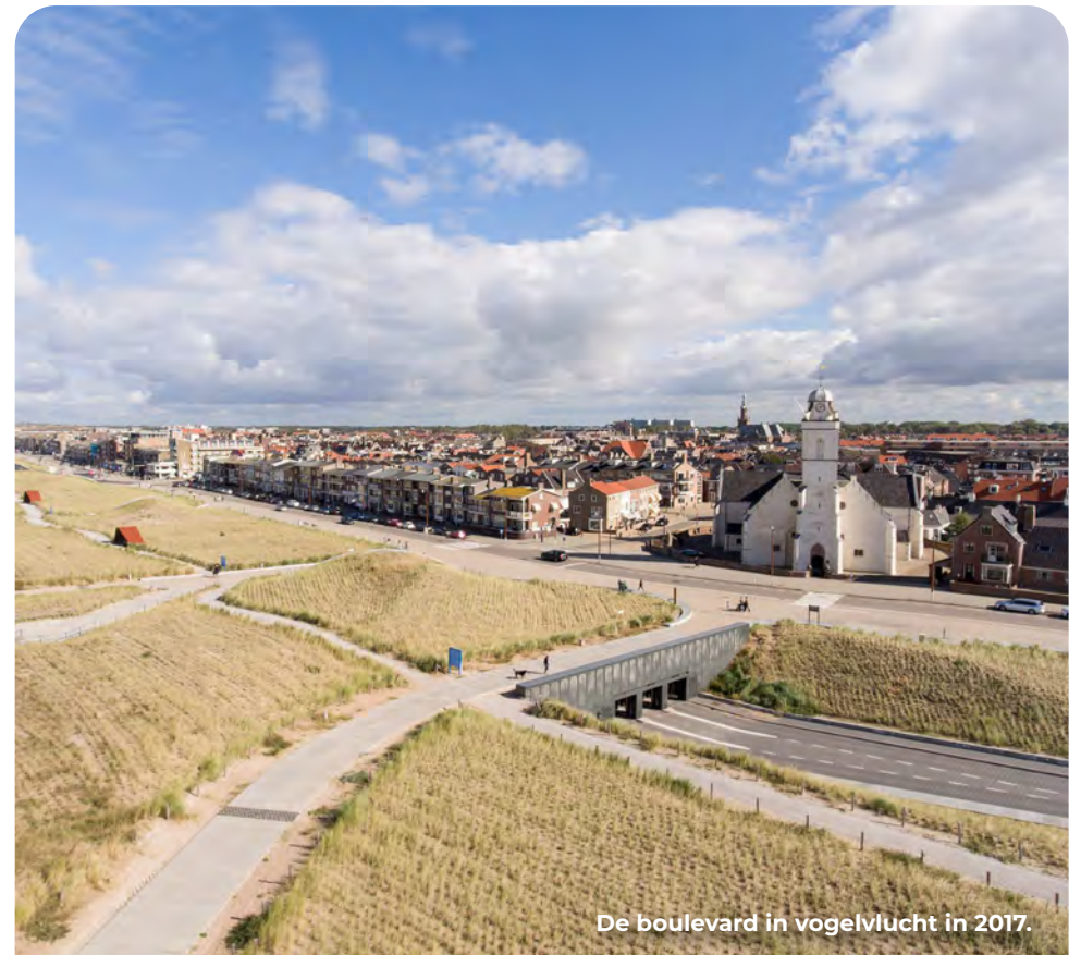
De boulevard in vogelvlucht in 2017.

De garage ligt onder een kunstmatige duinenrij die in 2014 is aangelegd om Katwijk in de toekomst tegen hoog water te beschermen. Tijdens de oorlog stond op deze locatie een honderden meters lange tankmuur met een hoogte van ongeveer 2,5 meter. Zowel voor, als achter de muur lagen verdedigingswerken van een Duits infanteriesteunpunt. De vier zware geschuts- en manschappenbunkers die voor de muur op het strand stonden, hadden een wanddikte van meer dan twee meter gewapend beton. Achter de tankmuur lagen bakstenen bouwwerken die onderling waren verbonden met een ondergronds, gemetseld gangenstelsel. Direct na de oorlog werd begonnen met de wederopbouw. Het strand en de boulevard waren weer nodig voor visserij, recreatie en woningen. Alle bunkers zijn daarom geheel of gedeeltelijk gesloopt en de muur werd in stukken gebroken, omgekegeld en begraven. De garage ligt tegen de restanten aan. Honderd meter verder is bij het DUNAatelier aan je rechterzijde een gedeelte van de muur als onderdeel van een monument zichtbaar gemaakt.