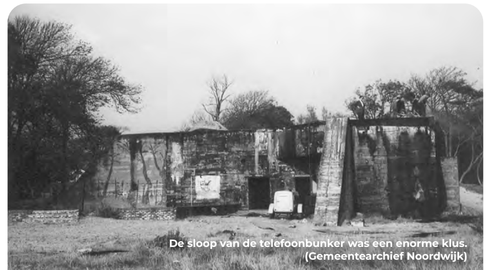
De sloop van de telefoonbunker was een enorme klus.

Vervolg de weg RD, sla bij de rotonde bij het tankstation LA de Schiestraat in richting KP 34. Bij KP 34 RD langs de kerk de HH Geestweg vervolgen. Deze gaat over in de Van Limburg Stirumstraat en vervolgens Pickestraat. Bij een 'vork' rechts aanhouden. De Pickestraat gaat over in de Oude Zeeweg. Eind van de klinkerstraat RA, hier gaat de geasfalteerde Oude Zeeweg richting KP 23. Bij KP 23 naar KP 22 (boulevard). Bij KP 22 LA naar KP 63. Bij KP 63 RD over de buitensluis. Sla RA de Boulevard op en volg de weg met de bocht mee naar links. Na 550 meter bereik je de parkeergarage op de Boulevard, het beginpunt van de route. In Noordwijk kan eventueel een bezoek worden gebracht aan twee musea die zich met de geschiedenis van de Tweede Wereldoorlog bezighouden: Atlantikwall Museum Noordwijk https://www.atlantikwall.nl/ Museum Engelandvaarders http://www.museumengelandvaarders.nl/