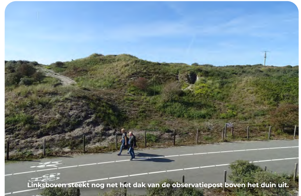
Linksboven steekt nog net het dak van de observatiepost boven het duin uit.

zeker in een Freie Küste waar de bouw van betonnen bunkers minder prioriteit kreeg. De constructie is simpel en bestond uit drie op elkaar gestapelde betonnen putringen. Precies hoog en breed genoeg voor een militair met volle bepakking. Op het hoogste punt van het duin zie je in het verlengde van het informatiebord in een zandverstuiving nog net de randen van twee van deze dekkingsgaten uitsteken.