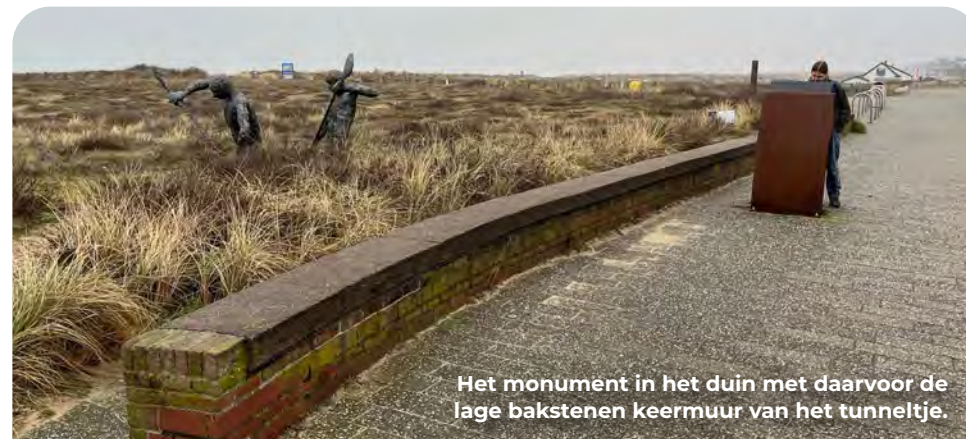
Het monument in het duin met daarvoor de lage bakstenen keermuur van het tunneltje.