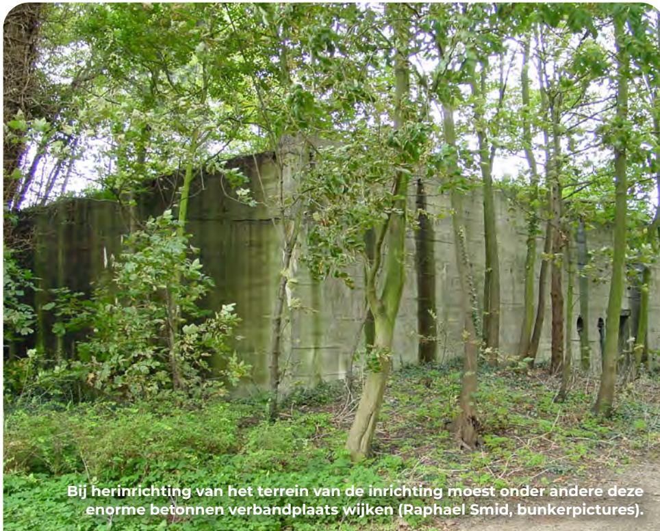
Bij herinrichting van het terrein van de inrichting moest onder andere deze enorme betonnen verbandplaats wijken.