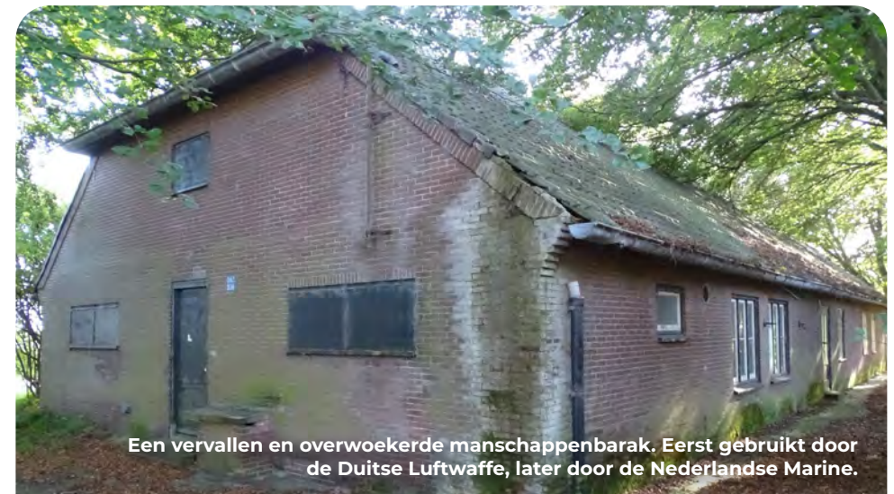
Een vervallen en overwoekerde manschappenbarak. Eerst gebruikt door de Duitse Luftwaffe, later door de Nederlandse Marine.

RD richting KP 93. Bij KP 93 LA Westerbaan in, wordt later Cantineweg. Na 1 kilometer zie je links tussen de bomen door, hoog op het duin, nog net een Duitse uitkijkpost staan. Dit is een landmark voor wandelaars. Aan het eind van de Cantineweg op een T-splitsing LA de Kon. Julianalaan op, na 600 meter eerste rotonde LA de Zeeweg in. Eerstvolgende rotonde RA (Karel Doormanlaan), en rotonde erna LA richting KP 62. Bij KP 62 richting KP 64.