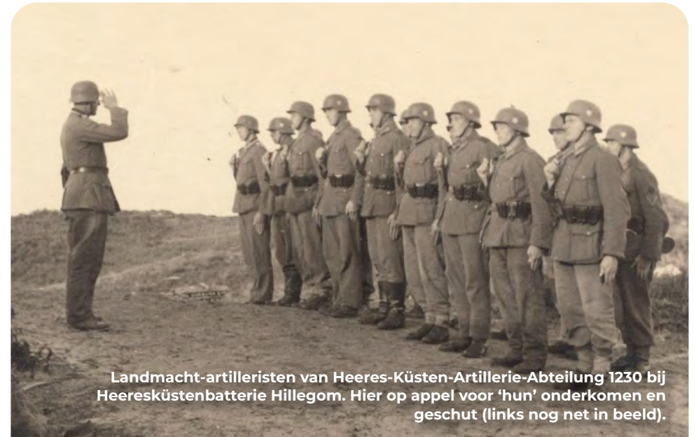
Landmacht-artilleristen van Heeres-Küsten-Artillerie-Abteilung 1230 bij Heeresküstenbatterie Hillegom. Hier op appel voor 'hun' onderkomen en geschut (links nog net in beeld).

De kustverdediging was niet alleen in handen van de Duitse marine. Ook de Duitse landmacht (Heer), beschikte over speciale kustbatterijen die de 'gaten' tussen de marinebatterijen opvulde. Heeresküstenbatterie Katwijk Alt was een van deze batterijen. De hoofdbewapening bestond uit vier stukken geschut met een kaliber van 17 cm die in grote open beddingen stonden. Elke bedding had een aangebouwd manschappenverblijf en munitieopslagbunker. Het waren enorme constructies waar in totaal duizenden kubieke meters beton voor nodig was.