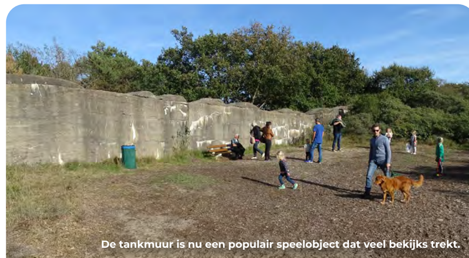
De tankmuur is nu een populair speelobject dat veel bekijks trekt.

Fiets vanaf het Panbos verder richting KP 93. Aan je rechterhand lag vliegveld Valkenburg. Je ziet verderop aan beide zijden van de weg verschillende Duitse bakstenen legeringsgebouwen.