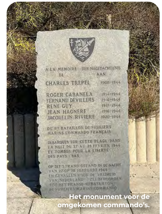
Het monument voor de omgekomen commando's.

De zes mannen bereiken daadwerkelijk de kust, maar hun landing verloopt verre van vlekkeloos. Ze worden kort na hun landing opgemerkt. Lichtkogels schieten de lucht in en vanaf de stelling bij de Wassenaarse Slag komen Duitse militairen direct in actie. Urenlang