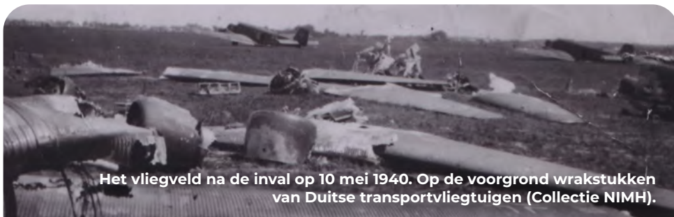
Het vliegveld na de inval op 10 mei 1940. Op de voorgrond wrakstukken van Duitse transportvliegtuigen.

Op het terrein bevindt zich nu een bezoekerscentrum waar de historie van het vliegveld wordt verteld: vliegveldvalkenburg.nl