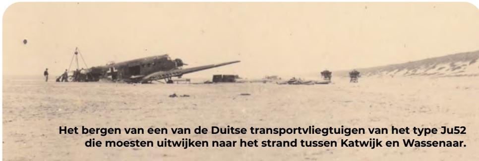
Het bergen van een van de Duitse transportvliegtuigen van het type Ju52 die moesten uitwijken naar het strand tussen Katwijk en Wassenaar.