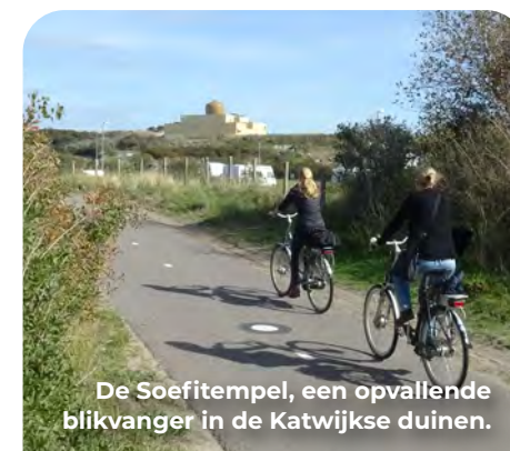
De Soefitempel, een opvallende blikvanger in de Katwijkse duinen.

Een opvallend bouwwerk in de Katwijkse duinen is de Soefitempel die aan je linkerhand zichtbaar is. De tempel is in 1969 gebouwd en is de enige tempel van het Universeel Soefisme ter wereld. In het Universeel Soefisme staat de vrijheid om je eigen weg te vinden centraal en worden de verschillende mystieke kernen van alle religies gerespecteerd en gebruikt als inspiratiebron.