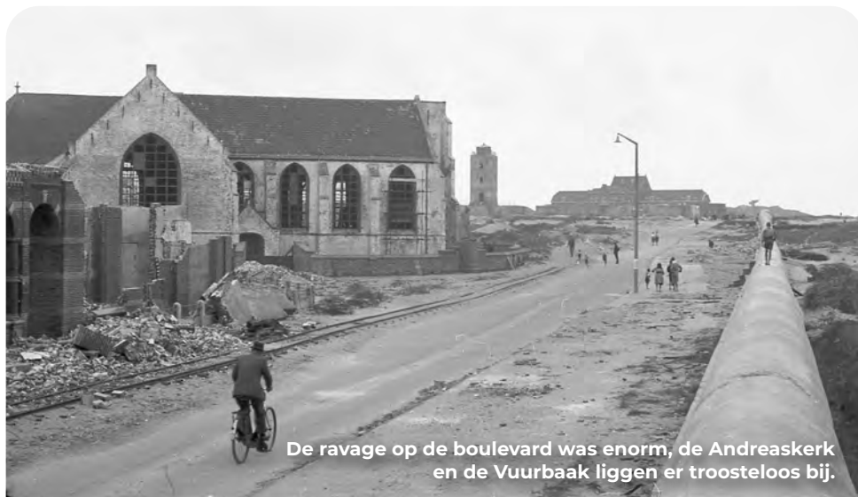
De ravage op de boulevard was enorm, de Andreaskerk en de Vuurbaak liggen er troosteloos bij.

De eerste herstelplannen voor de boulevard dateerden al uit de oorlogsjaren. In 1943 was het de gemeente die een ingenieur en architect de opdracht gaf een plan te maken voor herstel van de ontstane oorlogsschade. Op basis hiervan konden na de capitulatie snel knopen worden doorgehakt en was het mogelijk om een jaar later al te beginnen met het grootschalige herstel. De bouwwerken die in 1946 aan de kust verrezen zijn door de sterke variatie in ontwerp en de combinatie tussen traditionele en moderne elementen typerend voor de architectuur van de wederopbouwperiode. Men had er wel naar gestreefd om het oude dorskarakter met de oorspronkelijke kleinschaligheid en diversiteit terug te laten komen.