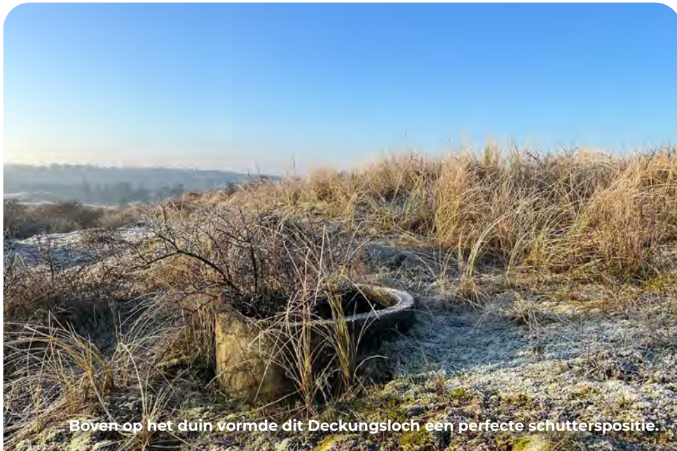
Boven op het duin vormde dit Deckungsloch een perfecte schutterspositie.