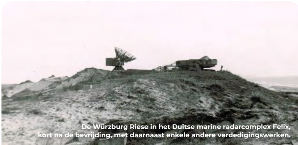
De Würzburg Riese in het Duitse marine radarcomplex Felix, kort na de bevrijding, met daarnaast enkele andere verdedigingswerken.