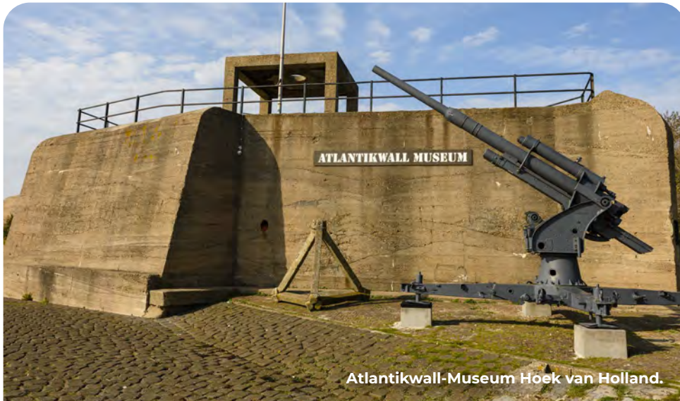
Atlantikwall-Museum Hoek van Holland.

Deze fietsroute zit bomvol militaire historie. De monding van de Nieuwe Waterweg vormt de toegangspoort tot de havens van Rotterdam en was voor de Duitse oorlogsindustrie van groot belang. Al in de 19e eeuw bouwden de Nederlanders hier een imposant fort en in de Tweede Wereldoorlog transformeerden de Duitsers het hele gebied tot een zwaar versterkte Festung.