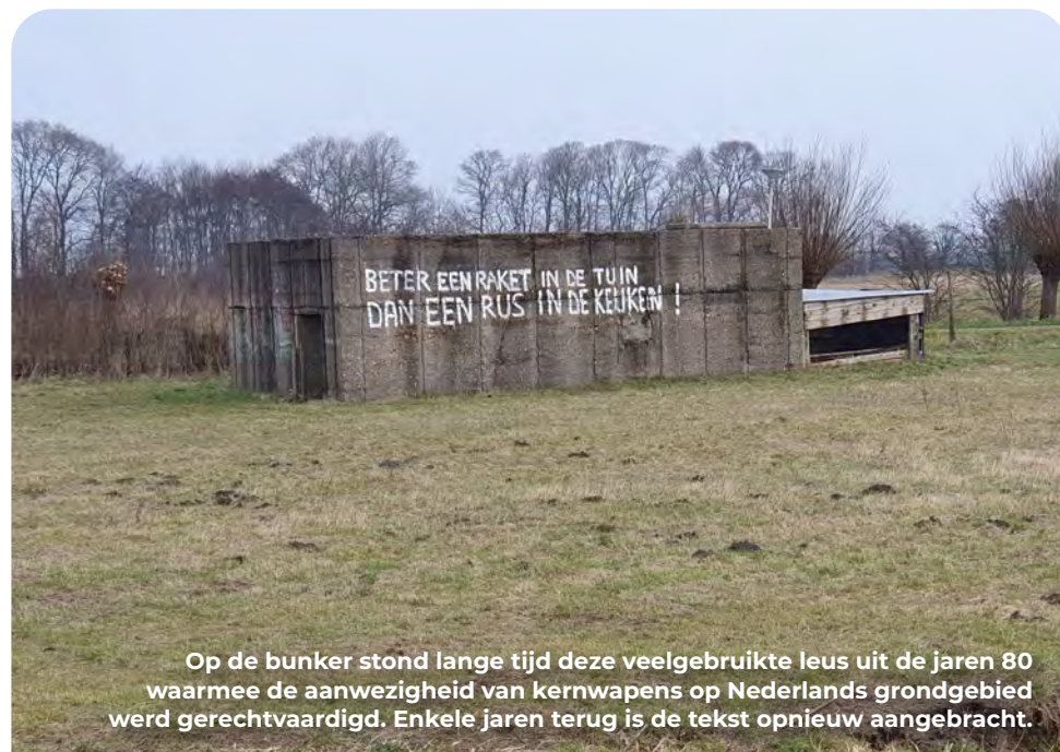
Op de bunker stond lange tijd deze veelgebruikte leus uit de jaren 80 waarmee de aanwezigheid van kernwapens op Nederlands grondgebied werd gerechtvaardigd. Enkele jaren terug is de tekst opnieuw aangebracht.

Je loopt het bos in over het brede pad (Oude Hooislag) en gaat na 150 meter RA op de Van Rijkevorselroute. Deze wandelroute is gemarkeerd met palen voorzien van een blauw rolstoelsymbool (± 1,5 km in een cirkel). Je kunt ook naar links naar het informatiecentrum d'Oude Koestal.