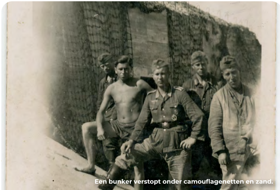
Een bunker verstopt onder camouflagenetten en zand.

Op de hoek van de Noordlandseweg-Zanddijk lag een steunpunt met tien grote bunkers. Het was het bataljonshoofdkwartier van het noordelijk gedeelte van de Festung Hoek van Holland. Behalve de gebruikelijke manschappen- en munitiebunkers waren hier ook centrale functies ondergebracht zoals een commandopost en een hospitaal. Je kan het vergelijken met het hoofdkwartier in het Staelduinse bos, maar dan kleiner. Het complex was bijzonder vanwege de camouflage. De bunkers waren voorzien van een zadeldak met schoorstenen en beschilderd met ramen en deuren, inclusief een oude dame achter het raam en bloemenvazen in de kozijnen. De camouflage als woonhuis werkte: de geallieerden gaven het complex op hun kaarten lange tijd aan als 'woonwijk'. Tegenwoordig liggen de bunkers verstopt tussen de bebouwing.