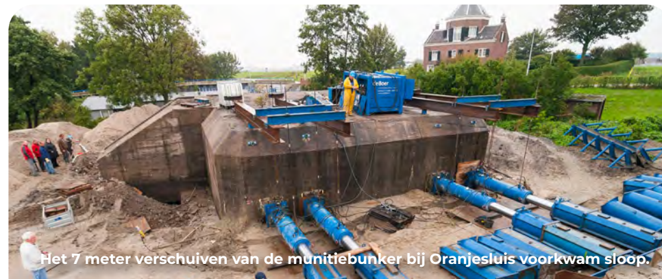
Het 7 meter verschuiven van de munitiebunker bij Oranjesluis voorkwam sloop.

bij de aanleg van de fietstunnels op het dak van een ander exemplaar. Naoorlogse archiefdocumenten gaven aan dat deze was gesloopt, maar niets bleek minder waar; alleen de stalen geschutskoepel was verwijderd.