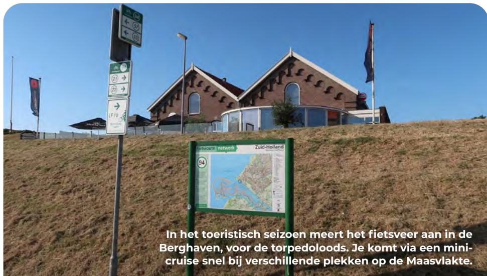
In het toeristisch seizoen meert het fietsveer aan in de Berghaven, voor de torpedoloods. Je komt via een minicruise snel bij verschillende plekken op de Maasvlakte.

Vanaf KP 94 fiets je naar KP 22. LA de spoorweg over, direct daarna RA. Bij KP 22 LA richting KP 19. Na een bunker aan je rechterhand, even vóór KP 19 ga je RA het Bonnenpad op naar KP 18.