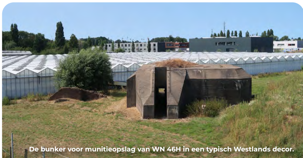
De bunker voor munitieopslag van WN 46H in een typisch Westlands decor.

Deze voormalige infanteriestelling maakte ook onderdeel uit van het Landfront met de tankgracht. Eén manschappenbunker is na de oorlog gebruikt als fundering voor een huis. De eigenaar kreeg geen bouwvergunning voor de bouw op zijn land, maar wel voor bouw óp de bunker. Hiernaast bevindt zich nog een munitiebunker. Iets verderop ligt de waterloop van de tankgracht. Het gedeelte rechts werd na de oorlog over een afstand van honderden meters gedempt en de omliggende grond verkaveld. Er kwamen nieuwe afwateringssloten en het werd tuinbouwgebied. In 2018 is ten zuidwesten van dit punt echter een nieuwe woonwijk verrezen en is als onderdeel van het ruimtelijk ontwerp de gracht weer uitgegraven, in aansluiting op het nog bestaande oude tracé. Er worden nu geregeld Atlantikwall-vaartochten georganiseerd.