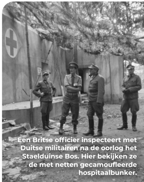
Een Britse officier inspecteert met Duitse militairen na de oorlog het Staelduinse Bos. Hier bekijken ze de met netten gecamoufleerde hospitaalbunker.

Vanaf KP 18 gaat het verder naar KP 23, hier aangekomen RA (Nieuw Oranjekanaal). Na een kilometer ligt bij de eerste afslag aan je Rechterhand (doodlopende weg) in de polder een kleine bunker.