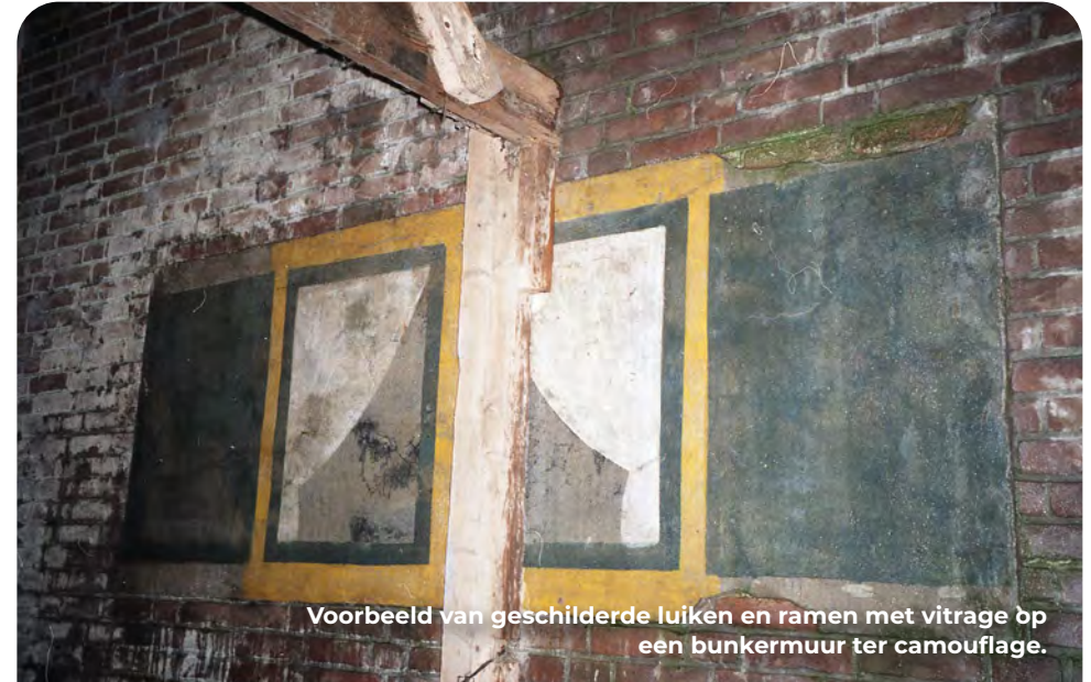
Voorbeeld van geschilderde luiken en ramen met vitrage op een bunkermuur ter camouflage.

Als je het kruispunt oversteekt, de Zanddijk in en naar rechts kijkt, zie je er enkele. De route gaat echter bij het kruispunt RA over het fietspad langs de drukke Noordlandseweg. Aan de linkerkant zie je weer enkele bunkers en honderd meter na de bushalte LA de Kreeklaan in, ligt aan het eind links het Bunker Museum Westland, gehuisvest in een grote commandobunker ( bunkermuseumwestland.nl ). Terug naar de Noordlandseweg. Eerste weg voor het tankstation rechts aanhouden (Noordlandselaan), gelijk weer rechts 't Louwtje inslaan. Aan het einde LA. Waar het fietspad de eerstvolgende strandopgang kruist RA (Slag Vlughtenburg). Volg de bocht in de weg en dan LA, het fietspad op richting Hoek van Holland. In de verte zie je de Zeetoren en de industrie liggen. Bij kruispunt RD.