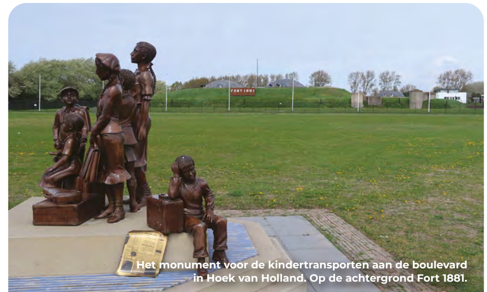
Het monument voor de kindertransporten aan de boulevard in Hoek van Holland. Op de achtergrond Fort 1881.

Met steun van de Britse regering, Joodse organisaties en vele vrijwilligers is aan het eind van de dertiger jaren van de vorige eeuw een operatie opgezet om ongeveer tienduizend Joodse kinderen uit verschillende bezette gebieden in Europa een beter leven te geven in Engeland. Aan de operatie gingen moeizame onderhandelingen vooraf. De kinderen mochten niet ouder zijn dan zeventien en ouders moesten achterblijven. Ze mochten ook niet veel meenemen: tien Reichsmark, een koffer, enkele foto's, maar verder geen speelgoed, boeken of waardevolle spullen. Op treinstations in onder andere Duitsland, Oostenrijk, Polen en Tsecho-Slowakije namen ouders en kinderen afscheid van elkaar, zonder te weten wat de toekomst zou brengen. Nadat de trein arriveerde in Hoek van Holland verliep de reis verder per stoomschip naar Harwich. Hier werden de kinderen opgevangen door gastgezinnen en kindertehuizen. Op 1 december 1938 vertrok het eerste transport uit Berlijn en op 14 mei 1940 vertrok het laatste transport uit Nederland. De meesten zouden hun ouders nooit meer terugzien. Architect en kunstenaar Frank Meisler was een van hen. Hij maakt monumenten ter herinnering aan de transporten: bronzen beelden van Joodse kinderen, op de vlucht voor de nazi's. Er staan monumenten op de stations van Gdansk, Berlijn, Liverpool, Londen en op deze plek langs de Nieuwe Waterweg.