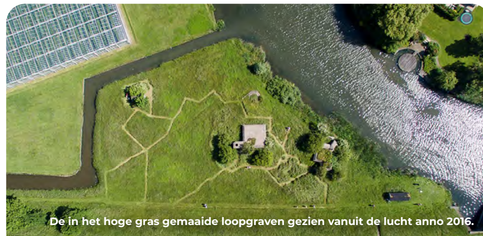
De in het hoge gras gemaaide loopgraven gezien vanuit de lucht anno 2016.

De sluis is in 1857 gebouwd 'tot ontginning van het Staelduin'. Aan de andere kant van de dijk liggen bunkers van een voormalige infanteriestelling van het buitenste Landfront. De tankgracht is grotendeels gedempt, maar hier zie je een oorspronkelijk