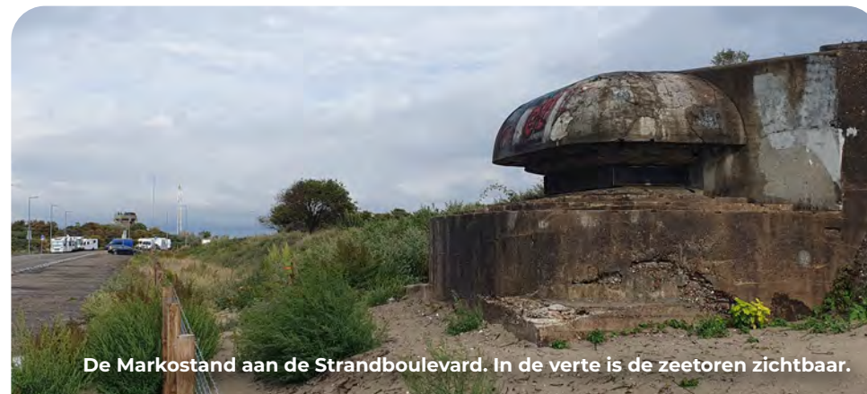
De Markostand aan de Strandboulevard. In de verte is de zeetoren zichtbaar.

Dit is één van de geschutsbunkers van de Duitse kustbatterij Vineta. Drie andere exemplaren liggen parallel aan de weg, maar zijn minder goed zichtbaar. Het Nederlandse leger bouwde op deze locatie in de Eerste Wereldoorlog al betonnen schuilplaatsen. In aanvulling hierop volgde eind jaren 30 de opstelling van de zogenoemde kustbatterij V met drie kanonnen. Vervolgens gebruikten de Duitsers veel van de Nederlandse bouwwerken en breidden het verder uit tot een groot complex van bunkers, onderling verbonden door ondergrondse gangen. Zo stonden er ook twee geschutsbunkers aan de landzijde, evenals munitiemagazijnen en manschappenverblijven.