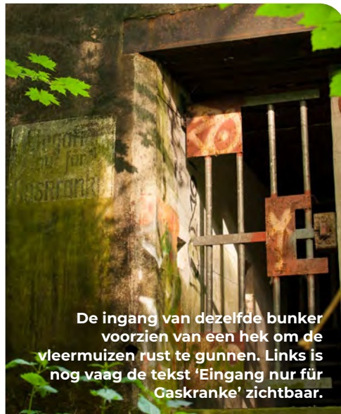
De ingang van dezelfde bunker voorzien van een hek om de vleermuizen rust te gunnen. Links is nog vaag de tekst 'Eingang nur für Gaskranke' zichtbaar.