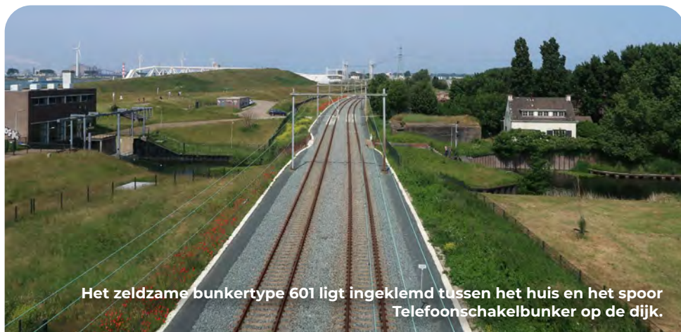
Het zeldzame bunkertype 601 ligt ingeklemd tussen het huis en het spoor Telefoonshakelbunker op de dijk.

Het gebouw op de Oranjesluis is een sluiswachterswoning. De sluis werd in 1676 gebouwd om zoet water in te laten voor de tuinen van het landgoed Honselaarsdijk. In de oorlog was dit de meest oostelijke punt van de Festung Hoek van Holland. De naastgelegen Maasdijk vormde de hoofdverbinding met het achterland en in het nabije Staelduinse Bos lag bovendien een belangrijk hoofdkwartier. Daarom werd op deze strategische locatie een groot bunkercomplex gebouwd dat één van de drie zwaar verdedigde toegangen vormde tot de Festung. Enkele jaren geleden is de infrastructuur rondom de sluis ingrijpend veranderd om de bereikbaarheid van Hoek van Holland te vergroten. Dit ging gepaard met het slopen van verschillende bunkers waardoor er nu nog maar eentje zichtbaar is. Deze munitiebunker is tijdens de werkzaamheden zeven meter verplaatst, maar daarbij scheefgezakt. Iedereen dacht dat dit de enige bunker was die nog resteerde, maar een paar jaar later stuitte men