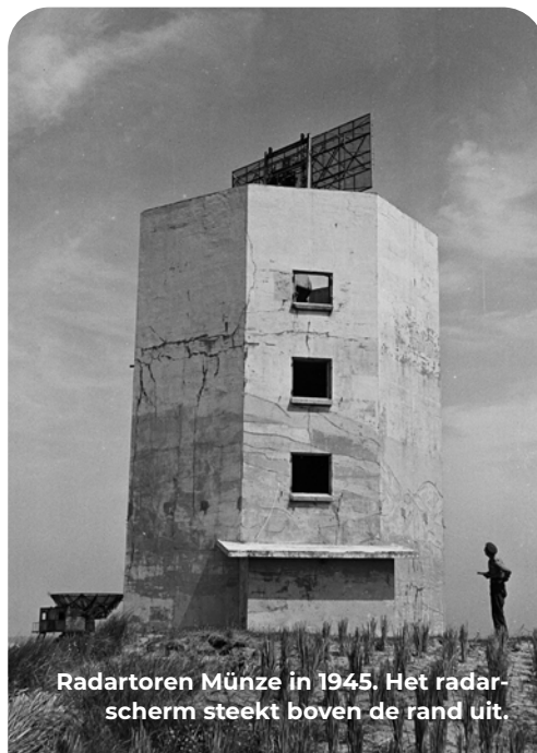
Radartoren Münze in 1945. Het radarscherm steekt boven de rand uit.

Ter hoogte van de Zeetoren bij de splitsing rechts aanhouden. Eerste LA (Klinkerweg), richting KP 21. Bij de parkeerplaats RA en daarna weer RA de Strandboulevard op. Na 200 meter zie je aan je linkerhand de 'neus' van een bijzondere bunker.