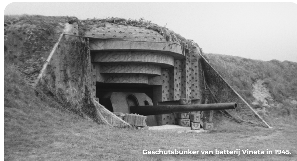
Geschutsbunker van batterij Vineta in 1945.

Aan de voet van het duin lag een rij houten duinpaviljoens. Deze werden in mei 1940 door de Duitsers gevorderd, maar halverwege de oorlog afgebroken ten behoeve van vrij schootsveld. Tijdens de Koude Oorlog nam de Nederlandse marine het complex in gebruik. Een markant overblijfsel uit die periode zijn de grote parabolantennes die deel uitmaakten van een Amerikaans militair radarverbingsstation uit de jaren 60, de zogeheten troposcatter. Hiermee kon een verbinding worden opgezet van Duitsland naar de Verenigde Staten. Zodoende zijn er vier fasen van militair gebruik te ontdekken. Het terrein met alle objecten kreeg in 2019 de status van Rijksmonument en is daarnaast een beschermd natuurgebied. De bunkers zijn daarom alleen toegankelijk tijdens rondleidingen van het Zuid-Hollands Landschap. Je kunt echter vaker terecht in de voormalige munitiebunkers 'Bremen' en 'Hamburg' waarin nu een fraai museum over de kustverdediging in is gevestigd ( forthvh.nl ).