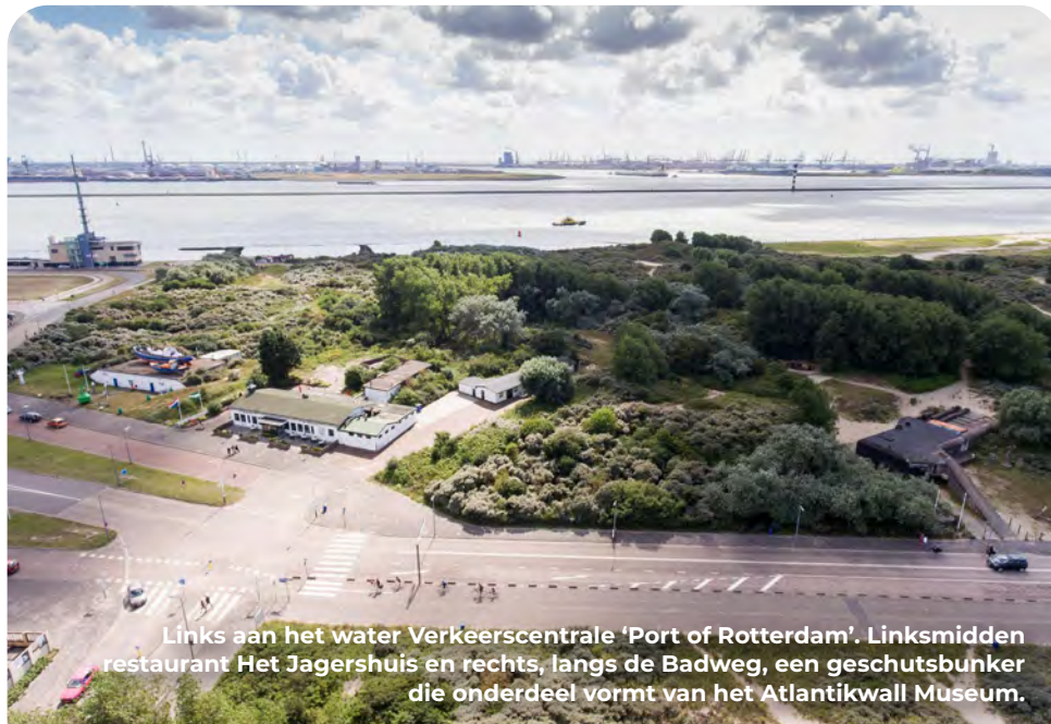
Links aan het water Verkeerscentrale 'Port of Rotterdam'. Linksmidden restaurant Het Jagershuis en rechts, langs de Badweg, een geschutsbunker die onderdeel vormt van het Atlantikwall Museum.

De snackbar die je passeert is tegen een mitrailleurbunker aangebouwd. Hier tegenover staat een monument voor de mensen die vanaf 1876 in de wateren voor Hoek van Holland zijn omgekomen, waarvan 122 slachtoffers tijdens gevechten in de oorlog.