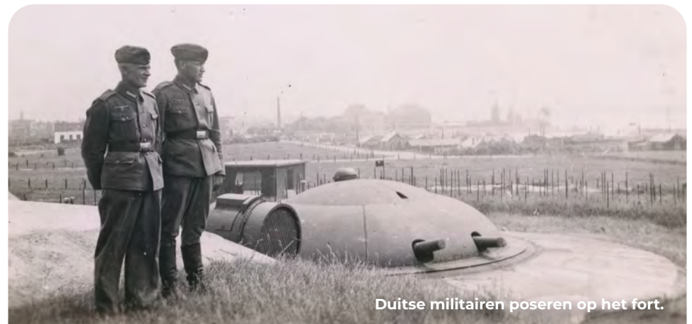
Duitse militairen poseren op het fort.

De gereconstrueerde geschutskoepels van het Fort aan den Hoek van Holland vallen op. Het tussen 1881-1889 gebouwde pantserfort moest de monding van de kort daarvoor aangelegde Nieuwe Waterweg beschermen. Door de snelle wapenwedloop aan het eind van de 19e eeuw was het enorme fort direct na de bouw al verouderd. Tijdens de bezetting gebruikten de Duitsers het fort voor verschillende functies waaronder telefooncentrale, (munitie)opslag, hospitaal en bovendien bouwden ze er een grote bakkerij met een capaciteit van duizenden broden per dag. Ze verschrootten de drie stalen geschutskoepels voor de eigen wapenindustrie. Het fraaie fort is nu een museum en de voormalige kantine is een café met terras ( fort1881.nl ).