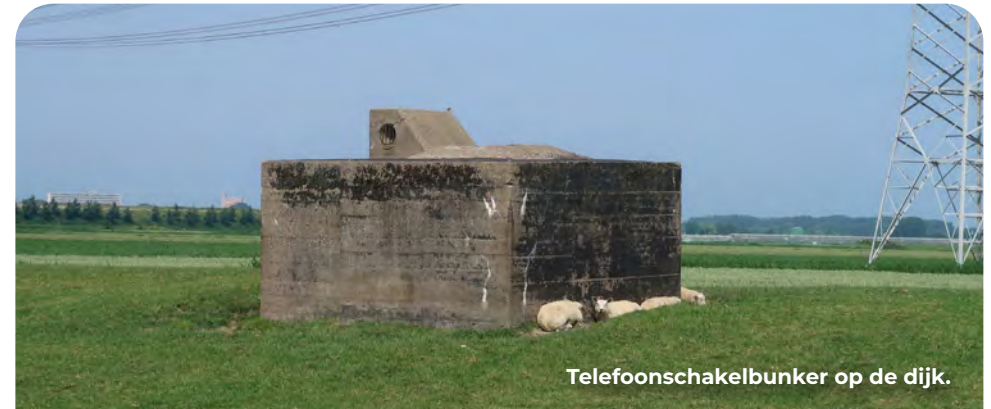
Telefoonschakelbunker op de dijk.