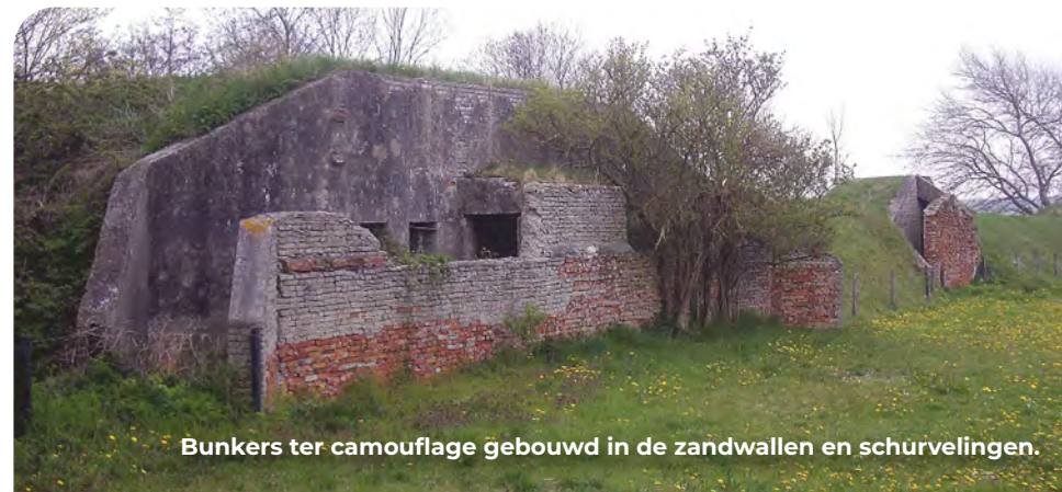
Bunkers ter camouflage gebouwd in de zandwallen en schurvelingen.

Op de Oostdijkseweg moet je 200 meter na de tweede weg naar links (Hofdijkseweg) opletten. Aan je linkerkant zijn enkele bunkers zichtbaar in twee haaks op de weg gelegen schurvelingen.