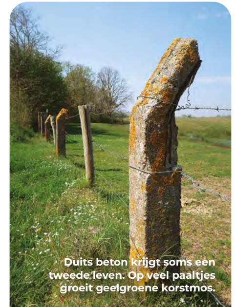
Duits beton krijgt soms een tweede leven. Op veel paaltjes groeit geelgroene korstmoss.

In de binnenduinen is in 1949 een zendstation van de Koninklijke Marine verzezen. Het bovengrondse antennepark is al van verre te zien. In de Koude Oorlog werd het als doelwit voor de Russen beschouwd als het tot een gewapend treffen zou komen. Tijdens de Tweede Wereldoorlog werd op dit terrein door de Luftwaffe een vlak van 80 meter breed en 750 meter lang geëgaliseerd. Het was zogenaamd een start- en landingsbaan van het nepliegveld 'Scheinflughafen 33'. Er stonden nepliegveld hangars en vliegtuigen van hout, ook was er een drainagesysteem en baanverlichting aangebracht. Op een rail werden lampen langs de baan gereden zodat het 's nachts leek alsof jachtvliegtuigen zich gereed maakten om te starten en vanuit een betonnen bunker werden lichtsignalen gegeven. Dit alles om de aandacht van geallieerde piloten af te leiden van echte vliegvelden, zoals die bij Waalhaven in Rotterdam. En het werkte, want er zijn regelmatig bommen afgeworpen. In de volksmond doet het verhaal de ronde dat de Britten met hun typische Engelse humor ook eens houten bommen hebben afgeworpen, als teken dat ze er niet altijd in traptten. Voordat je de bebouwde omgeving weer inrijdt staat aan je linkerkant de 'signaalbunker'.