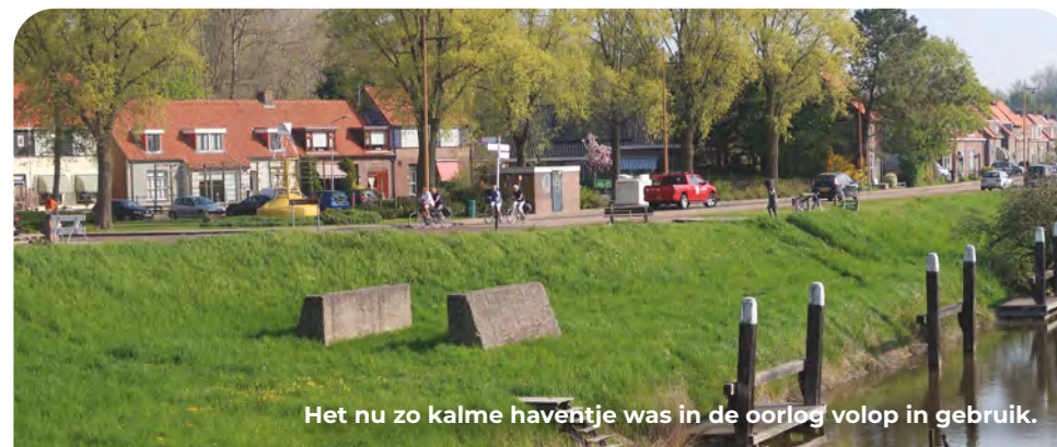
Het nu zo kalme haventje was in de oorlog volop in gebruik.

Bij de T-splitsing (herkenbaar aan een gele boei en aan de andere kant een Standbeeld) LA naar KP 62. Vervolgens KP 63.