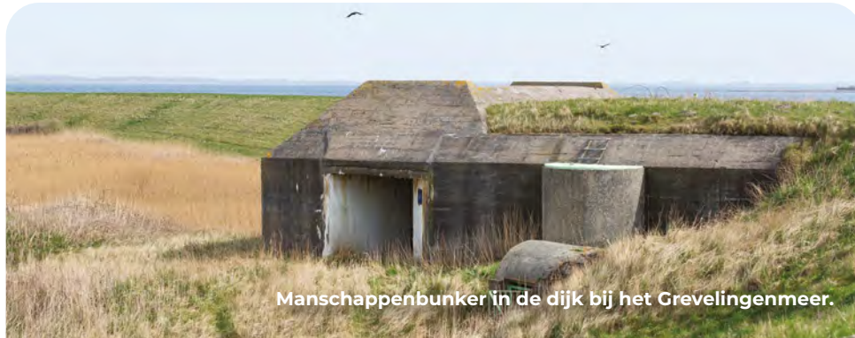
Manschappenbunker in de dijk bij het Grevelingenmeer.

De Grevelingen stond tijdens de oorlog nog in open verbinding met de zee. Daarom moesten in de dijken aan de oostzijde van het eiland ook bunkers komen, want daar konden immers geallieerden landen. Bij de knik in de dijk zie je een infanteriestelling waarvan alle bouwwerken in of tegen de dijk zijn gebouwd. De belangrijkste hiervan is de grote manschappenbunker van het type 501. Hier is een remise voor een kanon en een kleine gemetselde opslagbunker tegenaan gebouwd. Verderop ligt nog zo'n zelfde opslagbunkertje. Volgens Duitse inspectierapporten waren ze te vochtig voor de opslag van in karton of papier gewikkelde levensmiddelen. Apart vermeld werd dat ook de opgeslagen tabakswaaren hieronder leden. Omstreeks de eeuwwisseling zijn alle bouwwerken opgeknapt en is de open geschutsopstelling voor het antitankkanon opnieuw aangelegd.