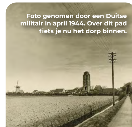
Foto genomen door een Duitse militair in april 1944. Over dit pad fiets je nu het dorp binnen.

De hoge kerktoeren van Goedereede was uitstekend geschikt als observatiepost. De waarnemers konden met hun verrekijkers schepen en vliegtuigen van verre zien aankomen maar ook mogelijke doelwitten op het land doorgeven aan artillerie. Op de top maakten de Duitsers een houten hok om droog en uit de wind te zitten. Ze maakten ook graag foto's in het historische stadje, net als de toeristen die hier tegenwoordig vele vakantiekiekjes schieten.