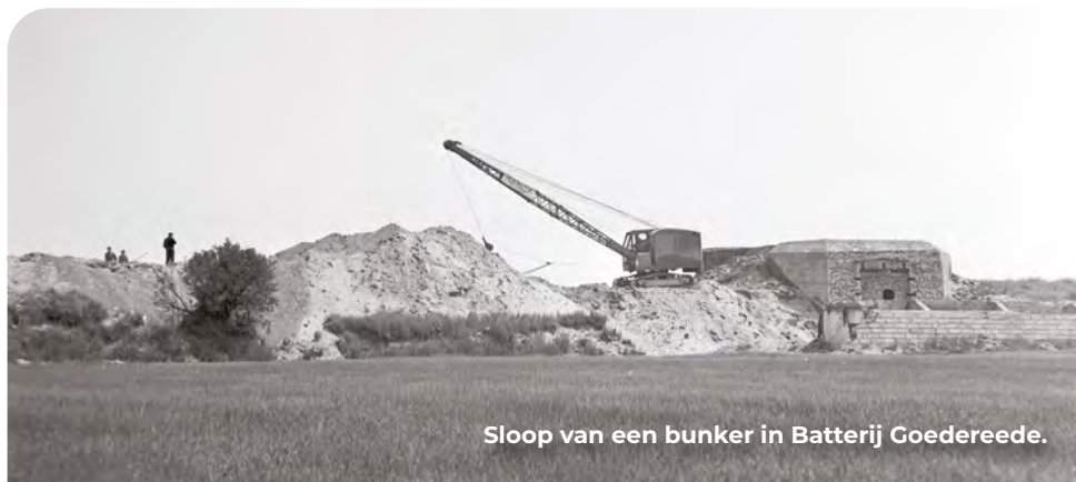
Sloop van een bunker in Batterij Goedereede.

Bij KP 63 aangekomen verder naar KP 67 (volg bordje KP 56).