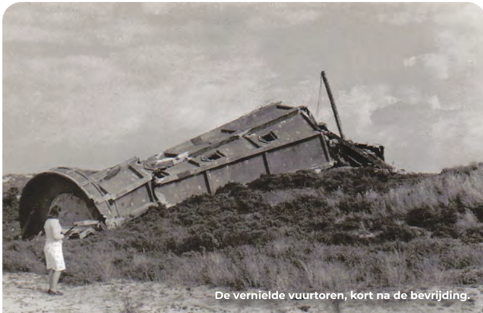
De vernielde vuurtoren, kort na de bevrijding.

Vervolg naar KP 51. Je fietst op de West Nieuwlandseweg met aan je rechterhand de duinen en links de polders. Bij een T-splitsing bij een boerderij met huisnummers 2 en 4, gaat de route RA naar KP 51. Voordat je dit doet volg je de weg echter nog voor 200 meter RD om een telefoonbunker te zien.