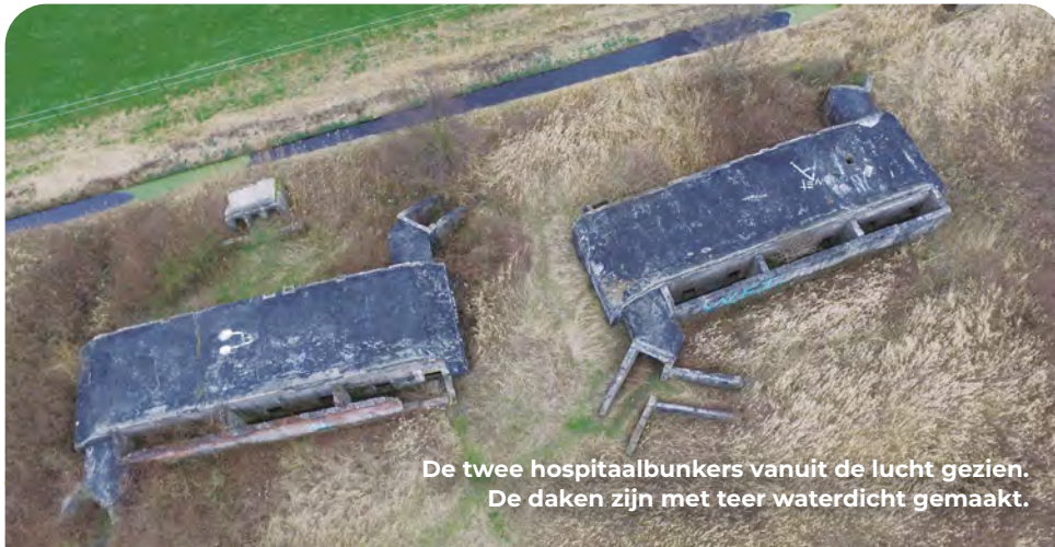
De twee hospitaalbunkers vanuit de lucht gezien. De daken zijn met teer waterdicht gemaakt.

van 1.700 liter. Ook het aantal van tien toiletten is veel in vergelijking met andere locaties waar militairen verbleven, dit heeft te maken met eventuele maag- en darmaandoeningen. Het hospitaal vormde onderdeel van het bataljonshoofdkwartier dat een kilometer verderop tussen de bebouwing van Ouddorp was gelegen. Anno 2025 worden de bunkers opgeknapt, de eigenaars zijn nog op zoek naar een goede herbestemming.