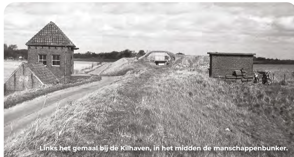
Links het gemaal bij de Kilhaven, in het midden de manschappenbunker.

Dit was ooit de Kilhaven waar suikerbieten van het achterliggende boerenland voor transport werden overgeladen op schepen. Aan de overkant van de weg bij het gemaal stond destijds in de dijk een manschappenbunker type 501 voor tien militairen. Op 5 april 1945 stortte vlakbij een Amerikaanse B-17 bommenwerper neer. Het was één van de vliegtuigen van een grote groep die op de terugweg was uit Duitsland waar ze een vliegveld bij Neurenberg hadden gebombardeerd. Door het slechte weer waren ze gedwongen laag te vliegen. Te laat ontdekten ze boven bezet gebied te zijn en werden beschoten door Duits luchtafweergeschut. Veel vliegtuigen konden niet meer ontkomen en één ervan stortte hier neer. Slechts een maand voor de bevrijding sneuvelden hierbij zeven van de tien bemanningsleden. Stichting WO2GO heeft een herdenkingspaneel geplaatst. Op de route kom je er nog enkele tegen van andere voorvallen.