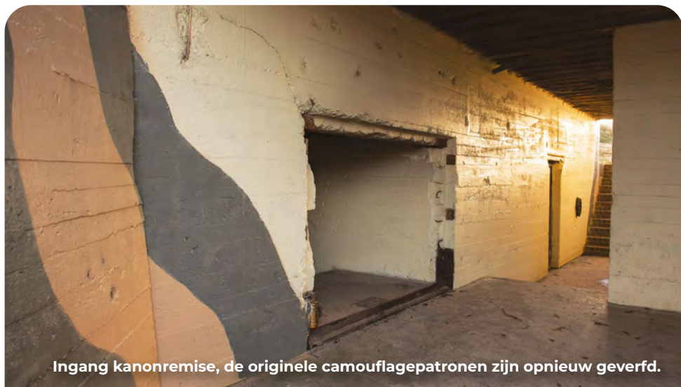
Ingang kanonremise, de originele camouflagepatronen zijn opnieuw geverfd.

Tijdens de oorlog was de Brouwersdam ter afsluiting van de zeearm tussen Goeree en Schouwen nog niet aangelegd. De plek waar je nu staat werd gedomineerd door het omliggende water van de Noordzee en het Grevelingen. Na de oorlog zijn er ten zuiden en oosten honderden meters land bijgekomen. De weg 'De Punt' bestond ook nog niet en ligt in lijn met wat destijds de grens vormde tussen land en water. Op deze meest zuidelijk gelegen locatie van de 'Kop van Goeree' konden de Duitsers vanuit deze hoog gelegen stelling met twee anti-tankkanonnen zowel de Noordzee als de Grevelingen bestoken. In de stelling zie je de geschutsbeddingen en de remises waarin de kanonnen veilig konden worden gestald. Laatstgenoemde zijn twee zeldzame bunkers van het type 504 waarvan er in Nederland nog maar één andere bestaat. De andere grote bunkers die je aantreft zijn een munitie en een manschappenbunker type 134 en 502. Verder bestond de stelling uit een aantal kleine bouwwerken waaronder een toilet, waterbergplaats en opstellingen voor mitrailleurs, vlammenwerpers, een schijnwerper en een buitgemaakte Franse tankkoepel. Hier tref je een replica van aan, evenals van een kanon waarvan de loop is gemaakt van een oude lantaarnpaal.