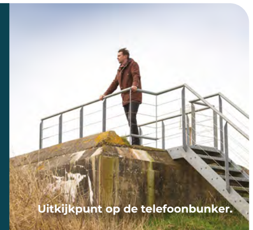
Uitzichtpunt op de telefoonbunker.

Het was hier, aan de zuidkant van Goeree, waar een oudere inwoner zich herinnerde: "Ik stond in de zomer van 1940 met mijn verrekijker op het duin, net gekregen van mijn ouders voor mijn achttiende verjaardag. Op dat moment kwam er een Duitse militair naar me toe; of hij ook eens mocht kijken. Die krijg ik niet meer terug dacht ik nog. Maar nadat hij over De Grevelingen richting het Zeeuwse Schouwen had gekeken gaf hij me het dure instrument terug en zei: "Diese Engländer werden wir bald angreifen."