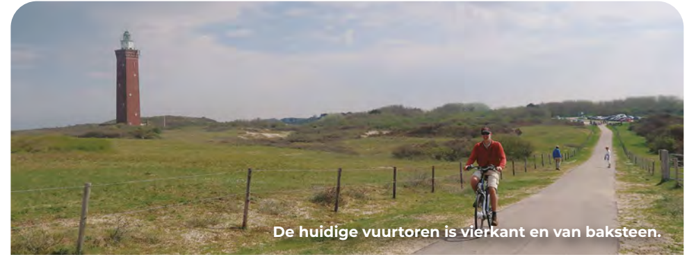
De huidige vuurtoren is vierkant en van baksteen.