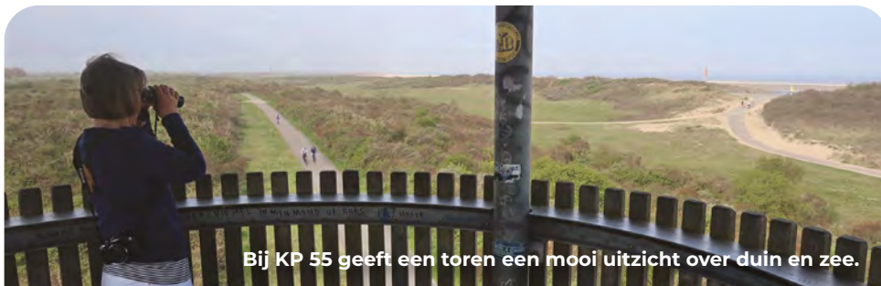
Bij KP 55 geeft een toren een mooi uitzicht over duin en zee.

Volg bij de T-splitsing niet KP 59, maar ga op dezelfde weg RD. Na plm. 300 meter RA een kleine weg in (genaamd Klinkerweg). Negeer de eerste afslag naar links. Op de driesprong links aanhouden, richting het strand en KP 56, KP 55 en KP 54. Een kilometer na KP 55 RA het eerste fietspad op, evenwijdig aan het strand. Je volgt hier niet langer richting KP 54, omdat je op de zeedijk een beter uitzicht hebt.