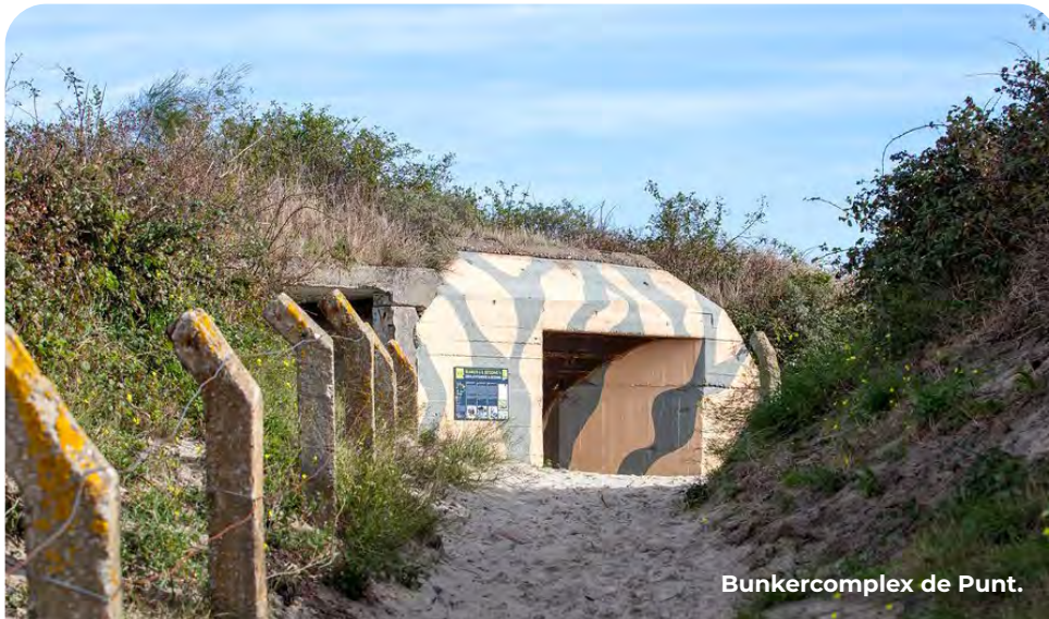
Bunkercomplex de Punt.

Op het destijds geïsoleerde eiland Goeree-Overflakkee waren geen belangrijke militaire doelen en vanwege het omringende water kon een aanval niet doorstoten naar het achterland. Daarom kreeg de Atlantikwall hier lage prioriteit en werden veel bunkers van bakstenen gebouwd in plaats van beton.