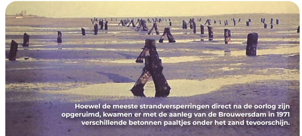
Hoewel de meeste strandversperringen direct na de oorlog zijn opgeruimd, kwamen er met de aanleg van de Brouwersdam in 1971 verschillende betonnen paaltjes onder het zand tevoorschijn.