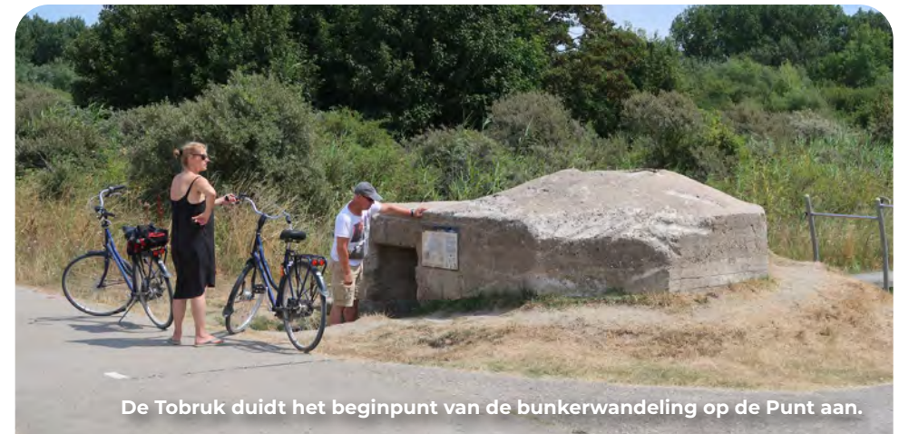
De Tobruk duidt het beginpunt van de bunkerwandeling op de Punt aan.

Dit exemplaar werd aan het Hoge Pad in Ouddorp aangetroffen tijdens voorbereidingen voor nieuwbouw van huizen. Het bijna 30 ton zware bouwwerk is in mei 2016 op een dieplader naar deze plek verplaatst om het begin van de wandelroute te markeren.