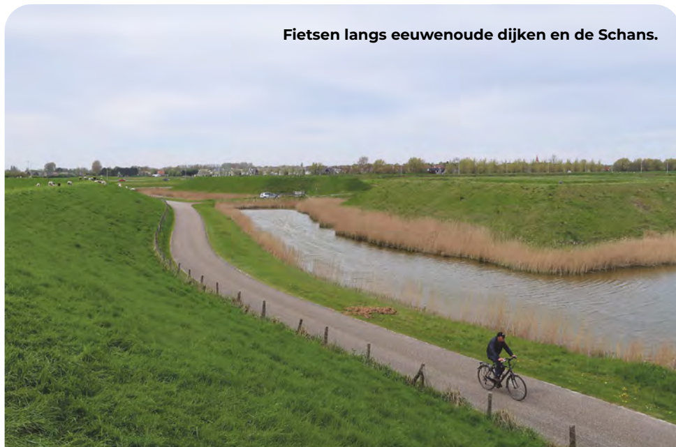
Fietsen langs eeuwenoude dijken en de Schans.

Bij KP 59 LA richting KP 68. Na het viaduct op de T-splitsing LA en gelijk RA fietspad op aan de linkerkant van het kanaal (Spuidijk), richting KP 61.