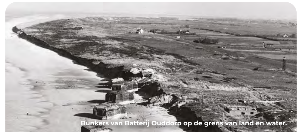
Bunkers van Batterie Ouddorp op de grens van land en water.

Bij de eerste strandovergang (nr. 5) zijn rechts onder aan de dijk drie Tetraëder geplaatst (zie ook punt 6). Tijdens de oorlog waren het strand en duin streng verboden terrein. De verlatenheid, de versperringen en het prikkeldraad maakten het tot een naargeestig gebied. In de duinen stonden bunkers van infanteriestellingen en op dit punt was Batterie Ouddorp Neu opgesteld. De zes kanonnen stonden aanvankelijk twee kilometer ten noorden (Alt), maar toen de geschutsbunkers medio 1944 in Neu gereed waren zijn ze verplaatst. Op deze locatie is duinafkalving al eeuwen een probleem. Na de watersnoodramp in 1953 werd dat goed zichtbaar door uit het duin op het strand gegleden bunkers. Ze zijn kort hierna gesloopt omdat ze voor de strandbezoekers een gevaar vormden. Het leeuwendeel van de bunkers op Goeree werd echter in het kader van de Deltawet in de jaren 60 gesloopt waardoor slechts foto's resteren. Kustversterking blijft een actueel thema; zeedijk 'het Flaauwe werk' waar je nu fietst is in 2008 drie meter verhoogd.