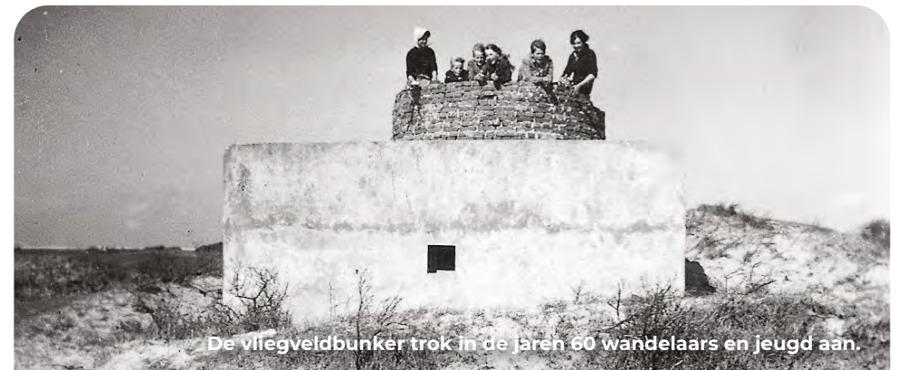
De vliegveldbunker trok in de jaren 60 wandelaars en jeugd aan.