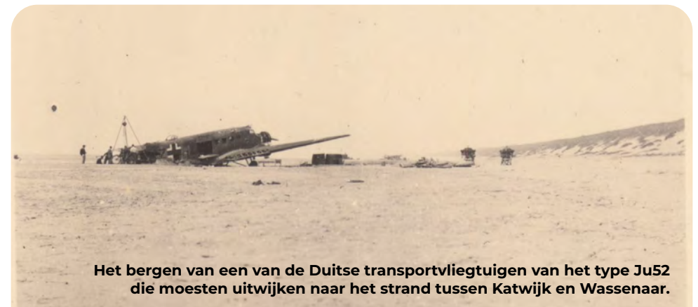
Het bergen van een van de Duitse transportvliegtuigen van het type Ju52 die moesten uitwijken naar het strand tussen Katwijk en Wassenaar.

Nog voor het uitbreken van de oorlog hadden Nederlandse militairen stelling genomen in de Wassenarse duinen en in Hotel Duinoord. Ze hadden de taak gekregen om met hun verouderde mitrailleurs aanvallen vanuit zee en lucht af te weren. In de vroege ochtend van 10 mei 1940 begon de hevige strijd om het