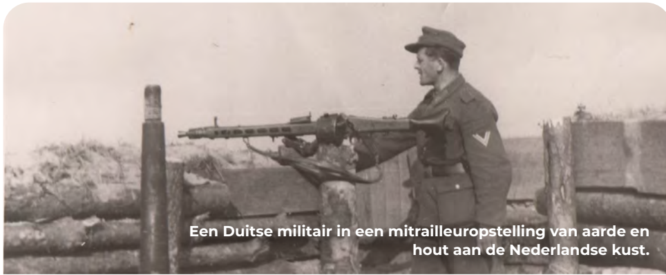
Een Duitse militair in een mitrailleuropstelling van aarde en hout aan de Nederlandse kust.