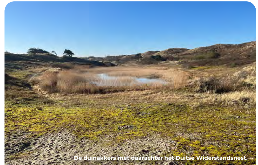
De duinakkers met daarachter het Duitse Widerstandsnest.

Achter deze akkers bevindt zich in de zeereep een Duits Widerstandsnest dat relatief goed bewaard is gebleven. Je ziet vanaf de weg langs het ruiterspad nog net een klein stuk van een gemetselde waterbergplaats. Op de hoogste en eerste