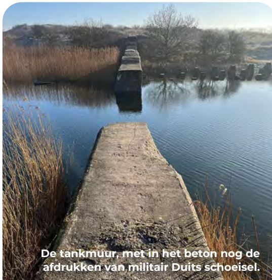
De tankmuur, met in het beton nog de afdrücken van militair Duits schoeisel.

De tankmuur is niet te missen. In de oorlog was deze dan ook zo goed mogelijk gecamoufleerd door er bomen en andere vegetatie op te schilderen. Om de lijn vanuit de lucht en vanaf de grond te maskeren werd de bovenzijde van een 'golvende' laag beton voorzien. De grens die hier lag, werd ook wel het zuidelijke Landfront genoemd en bestond uit een keten van mijnevelden, prikkeldraadversperringen, stukken tankmuur, tankgracht en drakentanden die vanaf het strand de gehele Stützpunktgruppe omsloten. Er waren slechts enkele doorgangen, waaronder voor een smalspoor, die vanuit nabijgelegen stellingen werden beschermd. Een deel van de muur is na de oorlog gesloopt. Het resterende deel heeft een lengte van ongeveer