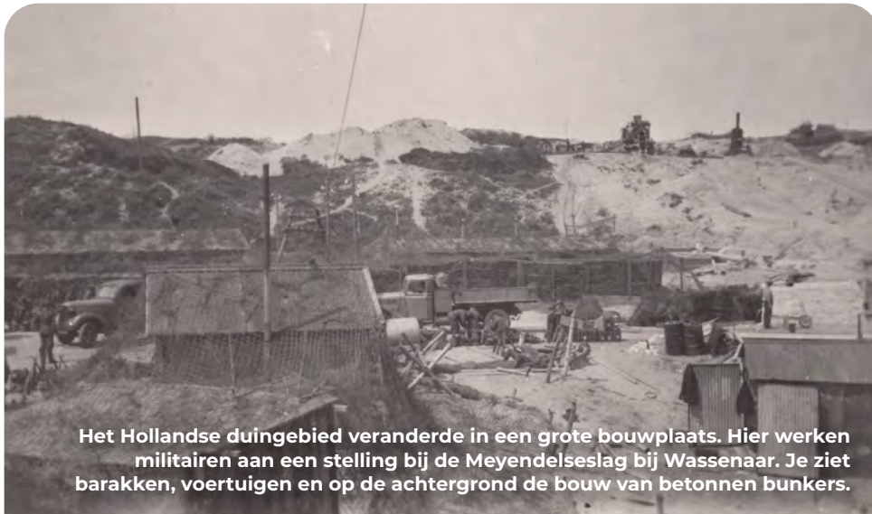
Het Hollandse duingebied veranderde in een grote bouwplaats. Hier werken militairen aan een stelling bij de Meyendelseslag bij Wassenaar. Je ziet barakken, voertuigen en op de achtergrond de bouw van betonnen bunkers.

In de Wassenarse duinen loop je door een deel van de Atlantikwall dat typerend is voor de zogenoemde Freie Küste. Veldversterkingen zoals loopgraven, enkele lichte bunkers en op vitale locaties grotere bunkercomplexen bepaalden hier het beeld. Bijzonder zijn vooral de drakentanden en de circa 1300 meter lange tankmuur met aangebouwde bunkers, die als een litteken door het duinlandschap snijdt.