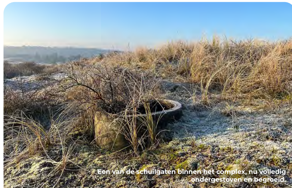
Een van de schuilgaten binnen het complex, nu volledig ondergestoven en begroeid.

Een betonnen Deckungsloch, of schuilgat, was een van de meest effectieve en snelle methoden om een goed beschermde en gedekte opstelling aan te leggen voor een schutter of schuilende militair. Je komt ze daarom langs de gehele Nederlandse kust tegen, zeker in een Freie Küste waar de bouw van betonnen bunkers minder prioriteit kreeg. De constructie is simpel en bestond uit drie op elkaar gestapelde betonnen putringen. Precies hoog en breed genoeg voor een militair met volle bepakking.