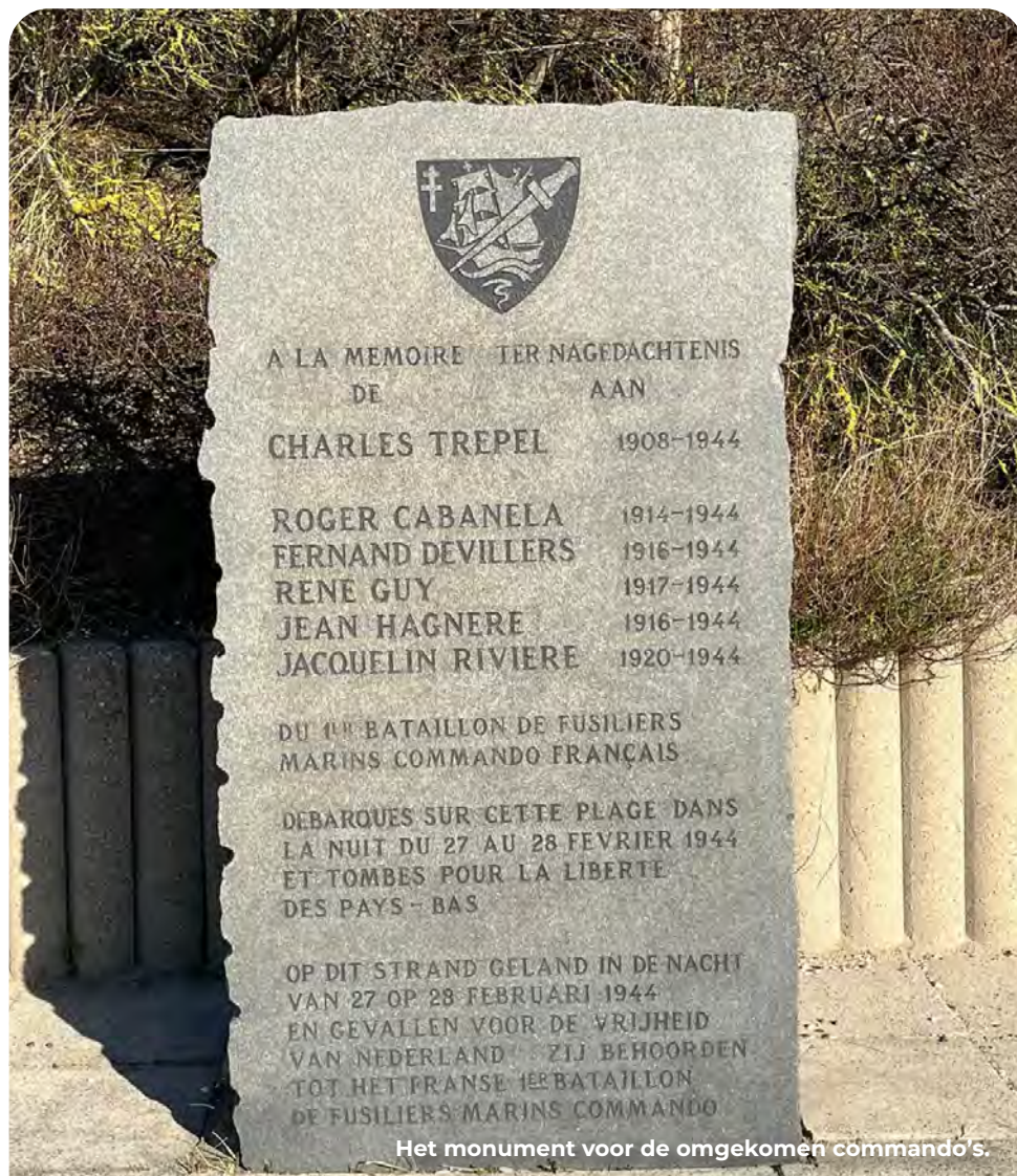
Het monument voor de omgekomen commando's.

Blijf op het geasfalteerde pad of loop evenwijdig door het rechts gelegen duinbos tot aan de parkeerplaats en Hotel Duinoord. Dit is het eindpunt van de route.