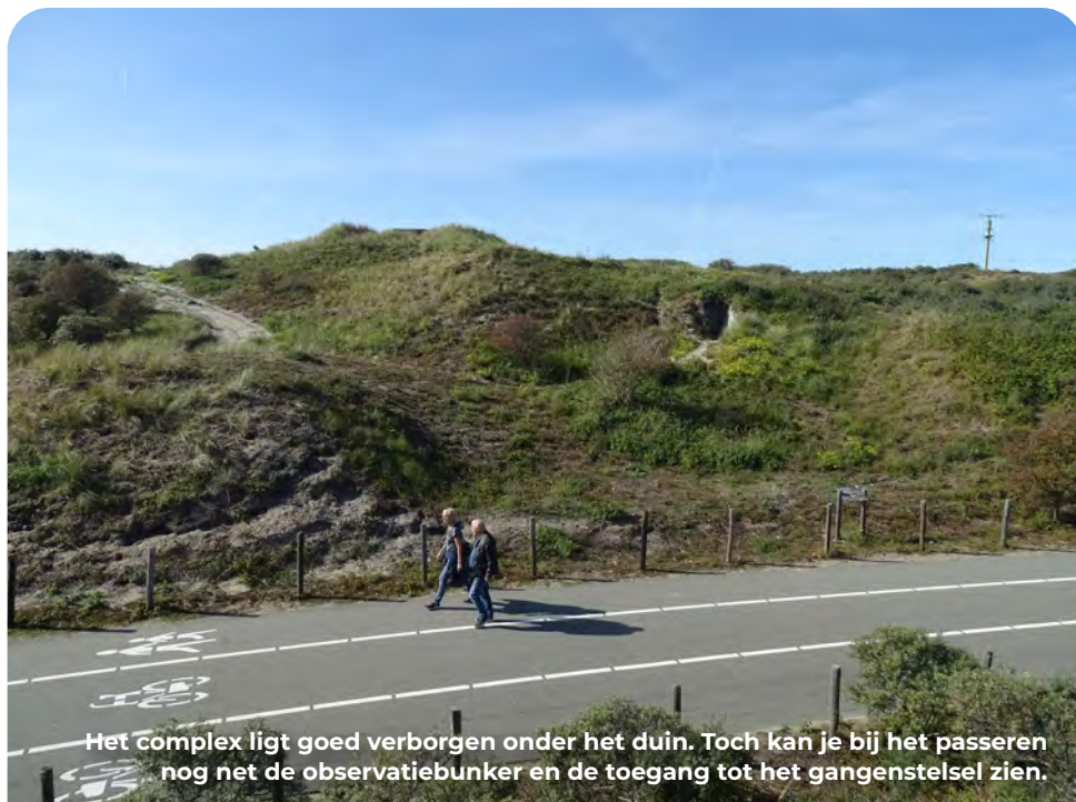
Het complex ligt goed verborgen onder het duin. Toch kan je bij het passeren nog net de observatiebunker en de toegang tot het gangenstelsel zien.

Aan je linkerhand zie je het herstelde duingebied waar je eerder doorheen bent gelopen. Vanaf het pad is goed zichtbaar hoe omvangrijk en dynamisch dit gebied is. Het landschap ziet er hierdoor elk seizoen weer anders uit. Aan je rechterhand lagen verschillende Duitse Widerstandsnester. De restanten liggen echter goed verscholen onder het zand en de begroeiing, waardoor je deze vanaf het pad niet zomaar kan herkennen.