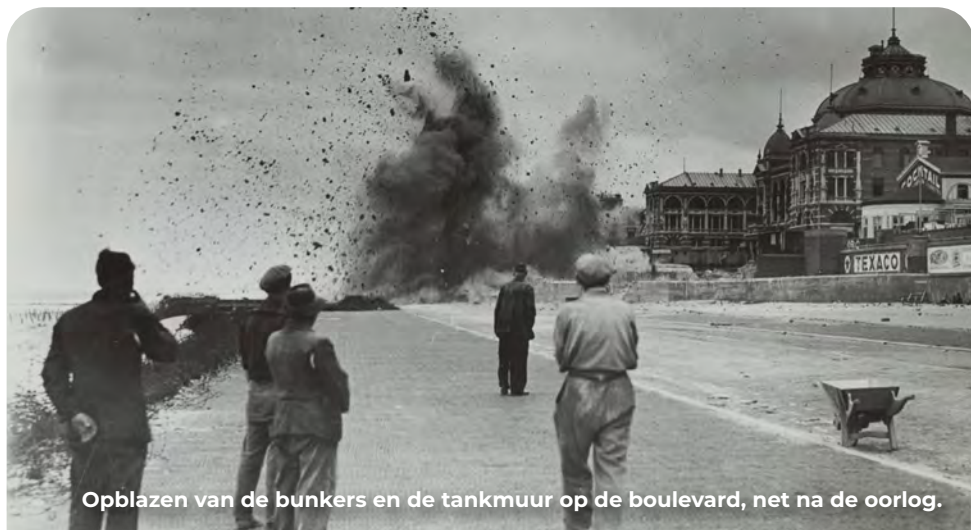
Opblazen van de bunkers en de tankmuur op de boulevard, net na de oorlog.

Tijdens de oorlog kreeg de boulevard een compleet ander aanzicht. Bijna over de hele lengte verrees een zware betonnen tankmuur, met geschutsbunkers en andere, grotendeels bakstenen, verdedigingswerken. Het strand lag vol versperringen en mijnen.