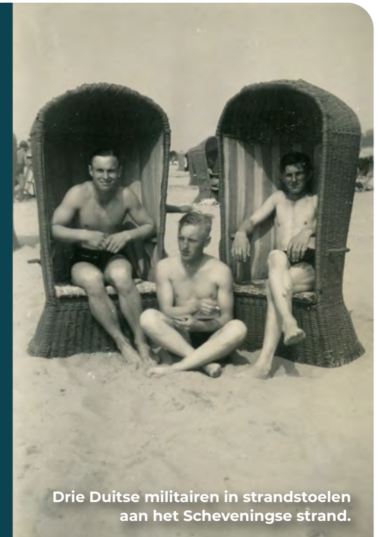
Drie Duitse militairen in strandstoelen aan het Scheveningse strand.

Het Scheveningse strand is uitermate populair, in de zomer staat de parkeerplaats bomvol. Destijds gedroeg ook de bezetter zich in "Holland" als toerist en kwam maar wat graag naar Scheveningen voor vertier. In de eerste twee oorlogsjaren ging het strandleven gewoon door, althans in een met prikkeldraad afgezet gedeelte. Veel militairen lieten zich op het strand fotograferen voor het thuisfront of als herinnering aan hun tijd in Nederland.