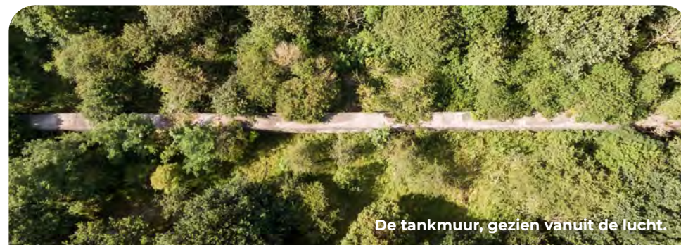
De tankmuur, gezien vanuit de lucht.

Loop verder, ga over het trapje, passeer de fietsenstalling rechts en loop tot aan het verharde fietspad. Steek het fietspad over en sla RA richting Scheveningen. Na 30 meter zie je aan je linkerhand in de bosjes een deel van een tankmuur (ter hoogte van een groene put).