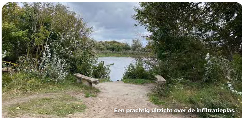
Een prachtig uitzicht over de infiltratieplas.

De overblijfselen van de Atlantikwall zijn hier opgegaan in een prachtig natuurgebied. Ze vormen waardevolle habitats voor verschillende dier- en plantensoorten. Het is een van de weinige ruïnelandschappen die we in Nederland nog rijk zijn. Vanaf deze plek heb je een schitterend uitzicht over de hier gelegen infiltratieplassen en de flora en fauna rondom deze waterpartij. Deze plassen zijn aangelegd om vanuit het binnenland aangevoerd rivierwater op te slaan en op natuurlijke wijze te zuiveren. Alleen op deze manier is het mogelijk de regio van voldoende schoon drinkwater te voorzien.