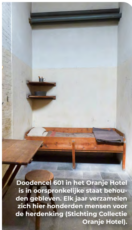
Doodencel 601 in het Oranje Hotel is in oorspronkelijke staat behouden gebleven. Elk jaar verzamelen zich hier honderden mensen voor de herdenking (Stichting Collectie Oranje Hotel).