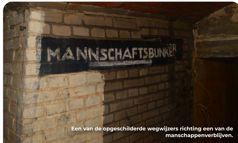
Een van de opgeschilderde wegwijzers richting een van de manschappenverblijven.