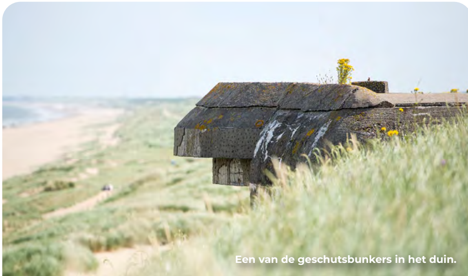
Een van de geschutsbunkers in het duin.

Deze wandelroute voert langs strand, duin en bos en toont hoe veelzijdig de Atlantikwall in Scheveningen was. Je volgt de sporen van kustverdediging, luchtafweer- en infanteriestellingen, maar ook plekken die herinneren aan verzet. Samen geven zij een goed beeld van Scheveningen tijdens de Tweede Wereldoorlog.