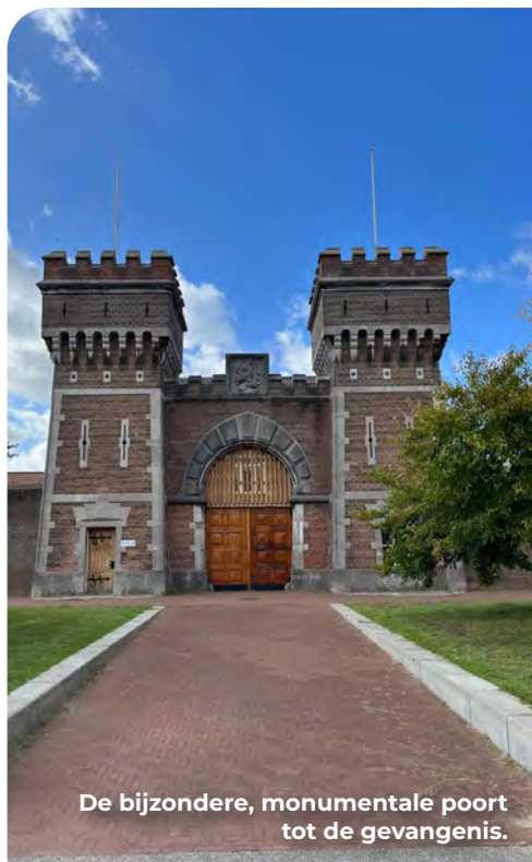
De bijzondere, monumentale poort tot de gevangenis.

Loop voorbij de indrukwekkende hoofdingang van de gevangenis en steek het kruispunt met de Doorniksestraat over en loop verder over het verharde voetpad de Nieuwe Scheveningse Bosjes in. Dit is het middelste pad.