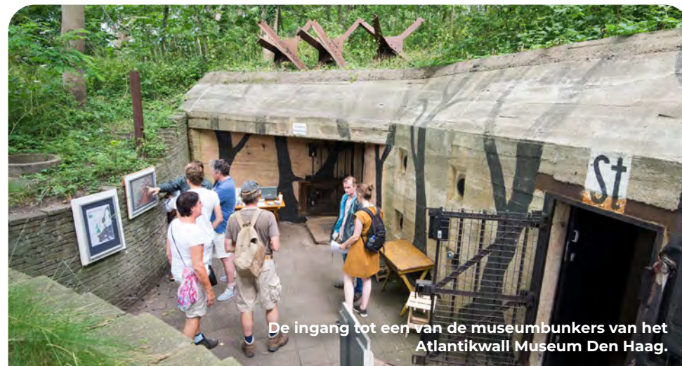
De ingang tot een van de museumbunkers van het Atlantikwall Museum Den Haag.