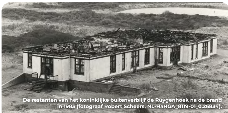
De restanten van het koninklijke buitenverblijf de Ruygenhoek na de brand in 1983 (fotograaf Robert Scheers, NL-HaGA_8119-01_0.26834).

Vervolg de weg vanaf de kruising verder naar beneden tot het pad een bocht naar rechts maakt en stop hier kort.