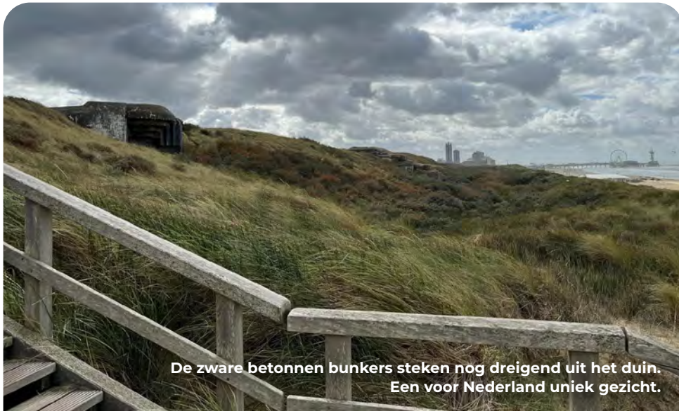
De zware betonnen bunkers steken nog dreigend uit het duin. Een voor Nederland uniek gezicht.