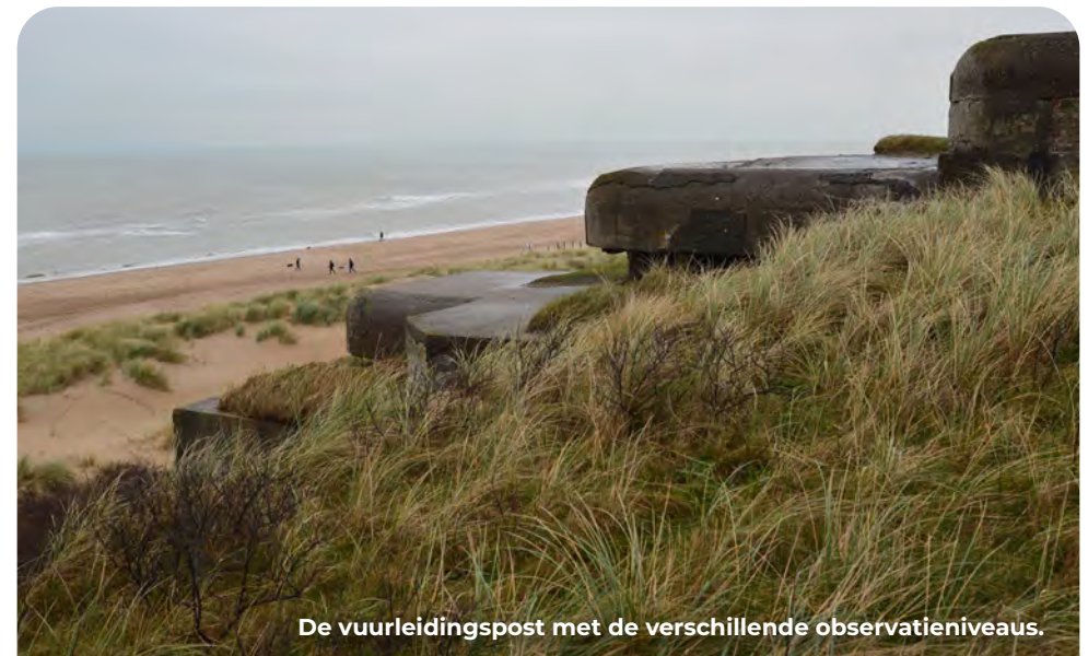
De vuurleidingspost met de verschillende observatieniveaus.

De batterij is symmetrisch ingedeeld. De kern bestaat uit de vuurleidingspost met aan weerszijden twee geschutsbunkers en drie van de oude open beddingen. Hierachter lagen de manschappenonderkomens en twee grote munitieopslagbunkers. Ook dit waren bouwwerken met wanden van minimaal twee meter dik beton. Deze bouwsterkte was noodzakelijk om bommen of scheepsgranaten te weerstaan. Geschut en personeel dat niet werd beschermd door beton liep bij een aanval grote risico's. De Duitsers bouwden hier uiteindelijk