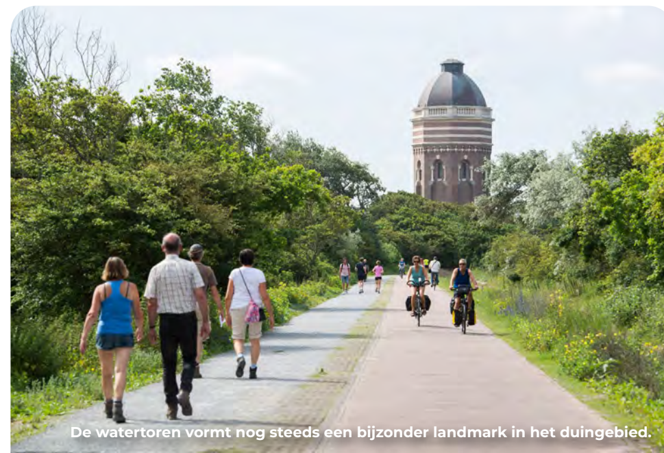
De watertoren vormt nog steeds een bijzonder landmark in het duingebied.

Loop RD tot aan de van Alkemadelaan. Steek de Van Alkemadelaan over en loop RD (nog steeds de Pompstationsweg).