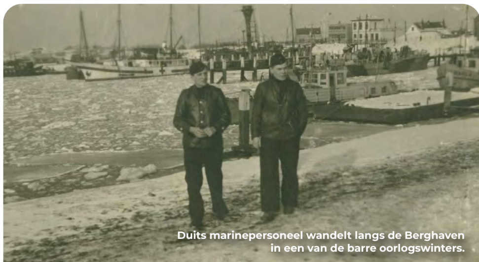
Duits marinepersoneel wandelt langs de Berghaven in een van de barre oorlogswinters.

Volg de Stationsweg mee met de bocht naar rechts richting het fort.