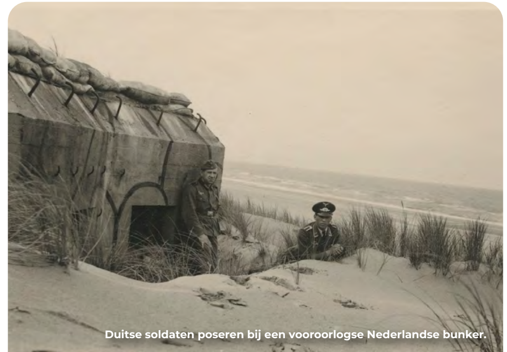
Duitse soldaten poseren bij een vooroorlogse Nederlandse bunker.