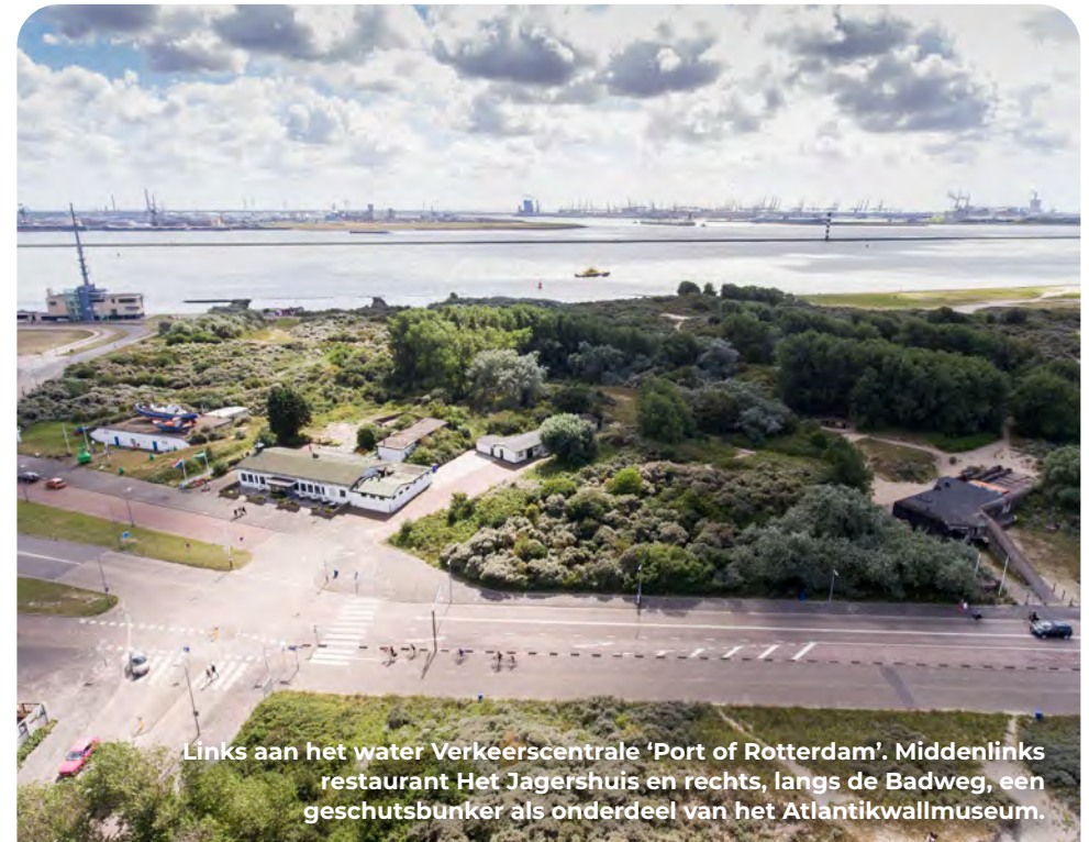
Links aan het water Verkeerscentrale 'Port of Rotterdam'. Middenlinks restaurant Het Jagershuis en rechts, langs de Badweg, een geschutsbunker als onderdeel van het Atlantikwallmuseum.

Na restaurant Het Jagershuis RA, je steekt de Badweg en het spoor over, RD de Strandboulevard op. Het duingebied aan de linkerzijde van deze weg is ontstaan door zandsuppletie. Tijdens de Tweede Wereldoorlog lag hier het strand en de zee.