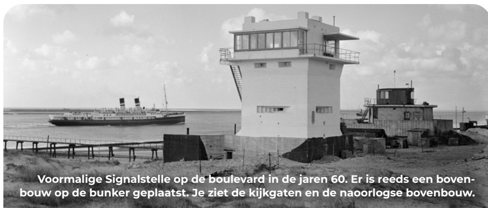
Voormalige Signalstelle op de boulevard in de jaren 60. Er is reeds een bovenbouw op de bunker geplaatst. Je ziet de kijkgaten en de naoorlogse bovenbouw.

Achter de bunker ligt Nordmole, één van de vier zware luchtafweerbatterijen van Hoek van Holland. Elke batterij had vier 10,5 cm kanonnen beschermd door