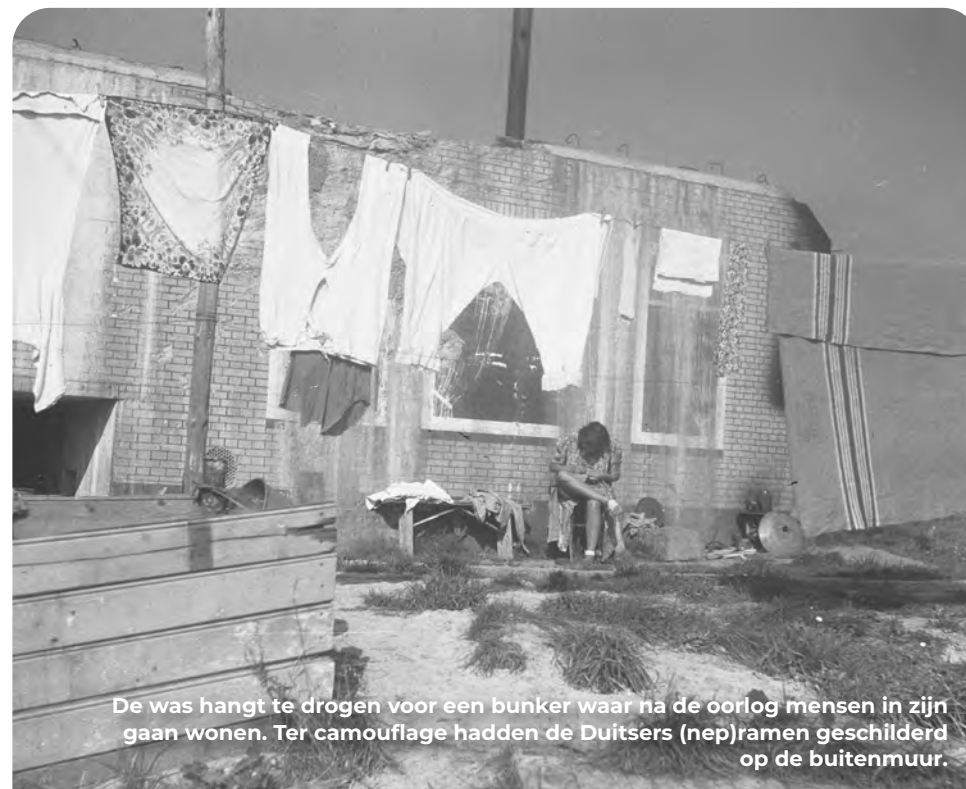
De was hangt te drogen voor een bunker waar na de oorlog mensen in zijn gaan wonen. Ter camouflaage hadden de Duitsers (nep)ramen geschilderd op de buitenmuur.

Hou op de volgende driesprong links aan. Je komt uit bij een doorgaande weg (Harwichweg). Steek de weg over en sla RA. Tot het einde doorlopen en de drukke Langeweg oversteken. Sla LA de stoep op richting de spoorovergang.