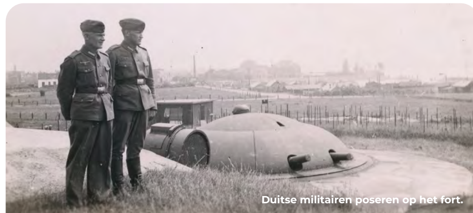
Duitse militairen poseren op het fort.