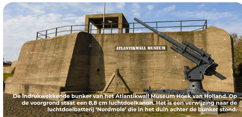
De indrukwekkende bunker van het Atlantikwall Museum Hoek van Holland. Op de voorgrond staat een 8,8 cm luchtdoelkanon. Het is een verwijzing naar de luchtdoelbatterij 'Nordmole' die in het duin achter de bunker stond.

Loop RD en je bent weer terug op de parkeerplaats.