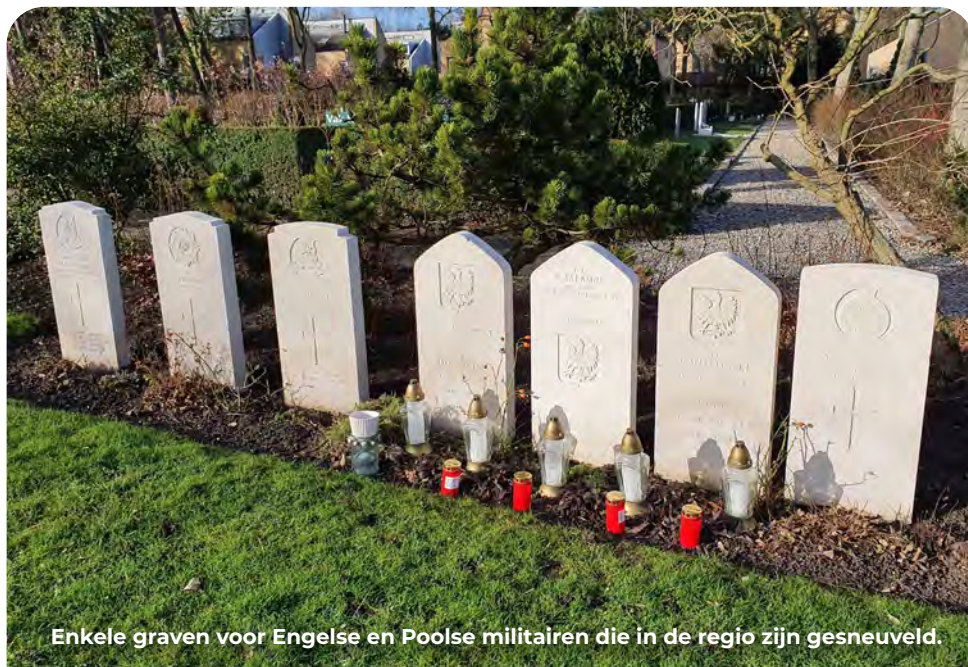
Enkele graven voor Engelse en Poolse militairen die in de regio zijn gesneuveld.

De gemeente reserveerde al aan het begin van de oorlog ruimte voor gesneuvelde militairen op de begraafplaats. In de beginperiode van de oorlog gaven de Duitsers hen nog een begrafenis met militaire eer. Op het erehof, bij binnenkomst rechts, liggen 69 doden uit landen van het Gemenebest. Ook bevinden er zich vijf Poolse en vijf Nederlandse oorlogsgraven. De overige nationaliteiten zijn elders herbegraven. De Duitse gesneuvelden liggen op de enige in Nederland bestaande Duitse militaire begraafplaats te Ysselsteyn (Limburg).