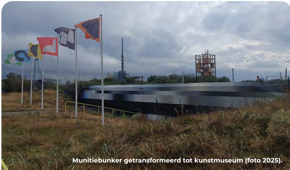
Munitiebunker getransformeerd tot kunstmuseum (foto 2025).

De grootste concentratie van Duitse bunkers in Nederland was gesitueerd in een gebied rond het dorp Hoek van Holland. Samen met elf andere plekken langs de West-Europese kust werd het op 19 januari 1944 door Hitler tot Festung verklaard.