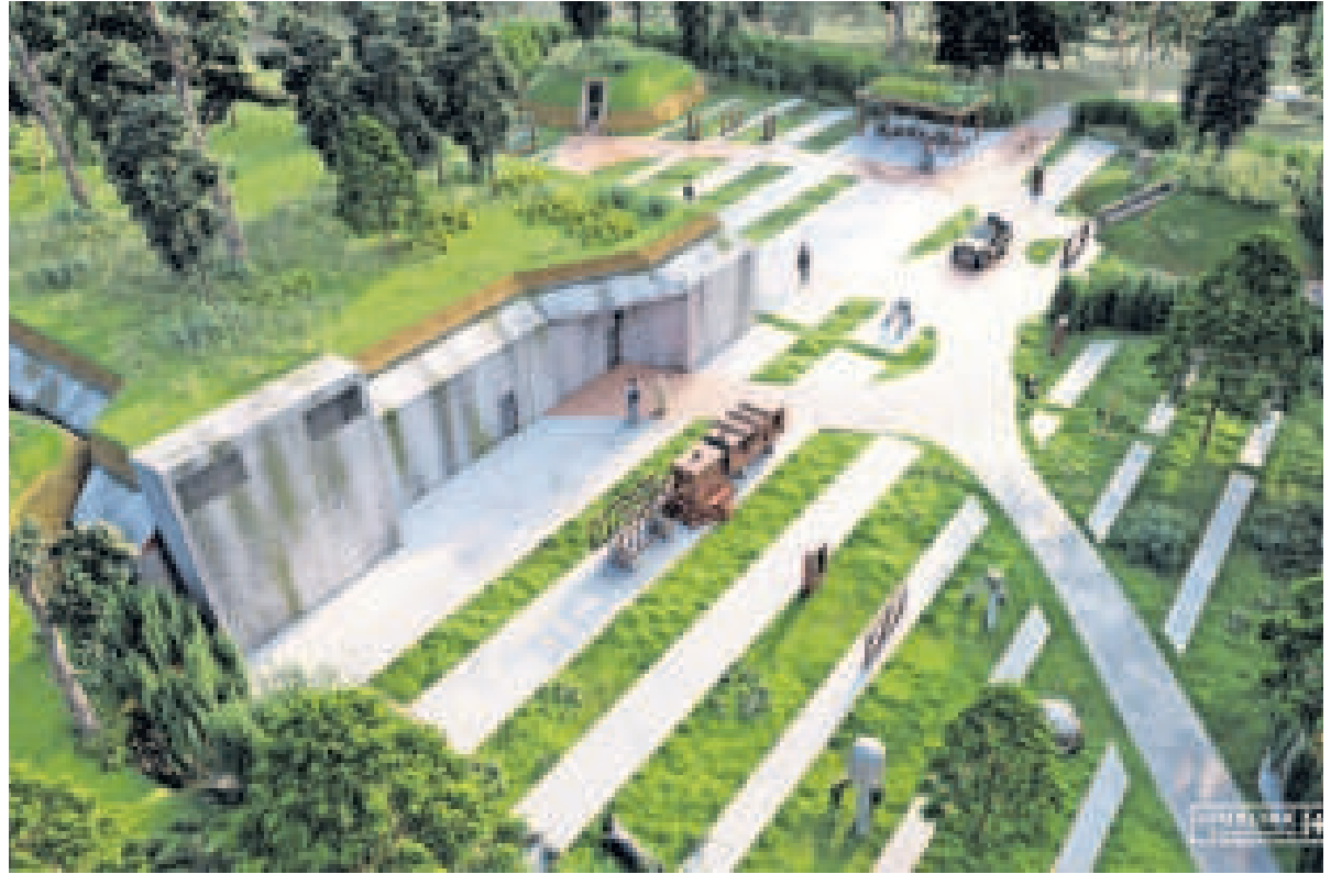
▲ Zo wordt de nieuwe situatie bij de Biberbunker. IMPRESSIE JUURLINK + GELUK STEDENBOUWEN LANDSCHAP

De komende maanden worden de werkzaamheden uitgevoerd.