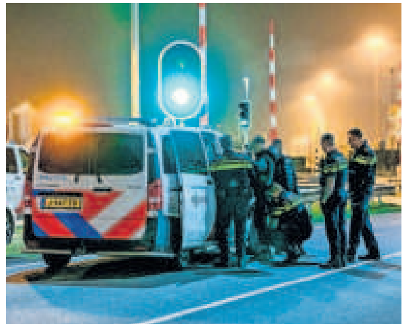
▲ De politie pakte onder meer op de Maasvlakte jonge Spijkenissers op die drugs uit een container haalden.